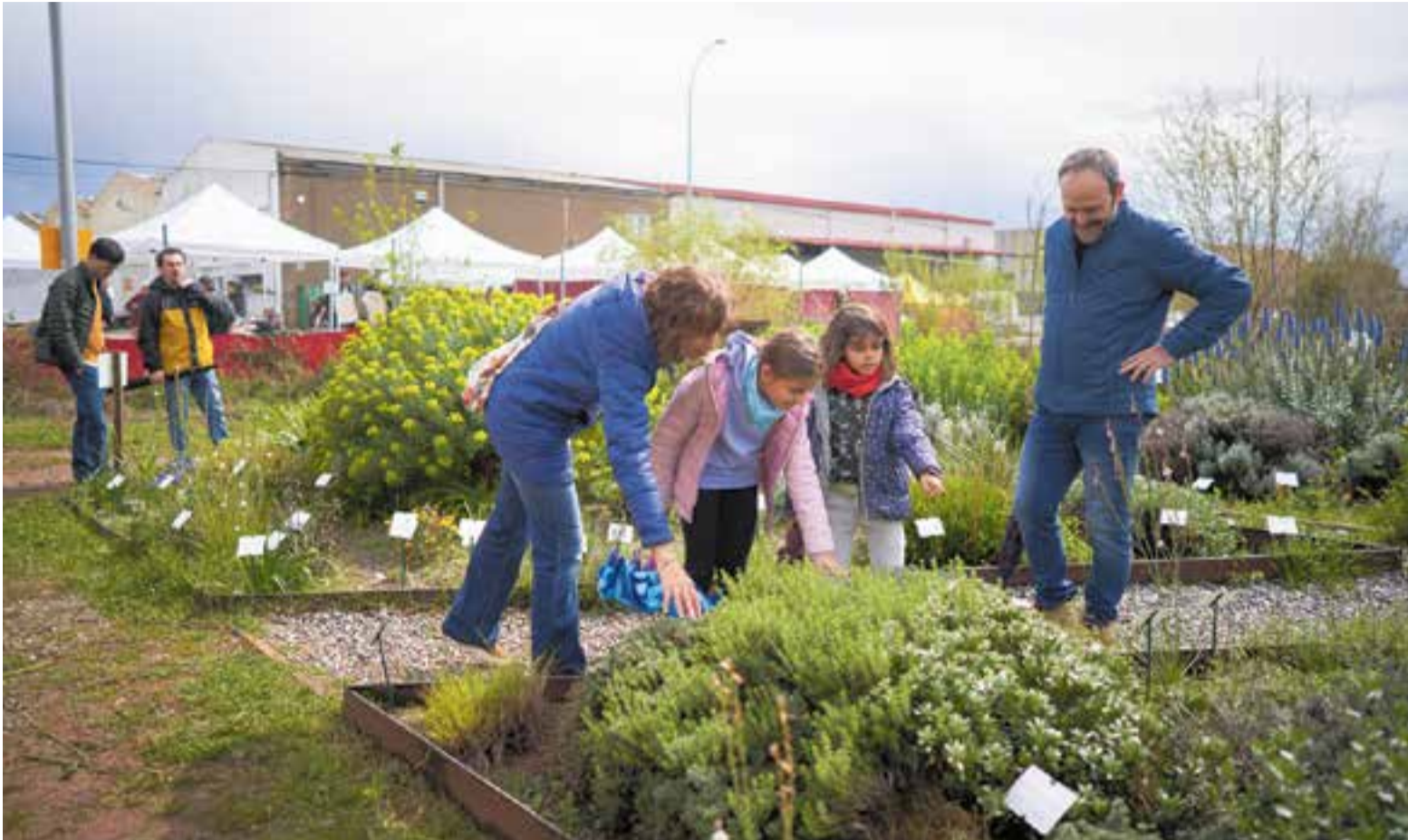
Una família visitant les instal·lacions del jardí sense reg de l'Institut Les Garberes durant la celebració de la Fira de Plantes del Segle XXI.