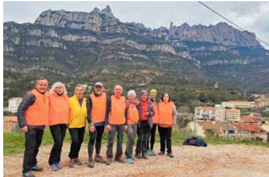
Els organitzadors del Centre Excursionista als peus de Montserrat.