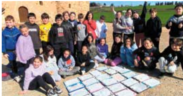
Alumnat de l'IE Sant Esteve després de fer l'activitat a Can Santpere.

Al final de la sessió es posaran en comú els dibuixos de tots els participants, es fotografien i també es faran una foto de grup de tots els participants a la sortida. Entre els objectius de l'activitat hi ha contribuir a la divulgació i formació sobre el dibuix, promoure i desenvolupar el valor artístic, narratiu, educatiu i social del dibuix i compartir una estona tranquil·la a l'entorn natural o urbà de Castellar del Vallès mentre es dibuixa. L'activitat va començar el 4 de març amb una visita a Can Sant Pere amb els alumnes de 5è B de l'EI Sant Esteve. + || REDACCIÓ