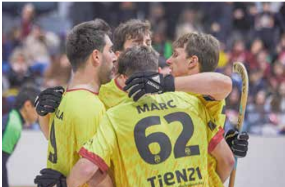
Sis jornades queden a l'HC Castellar per acabar la Lliga i classificar-se per a l'ascens.