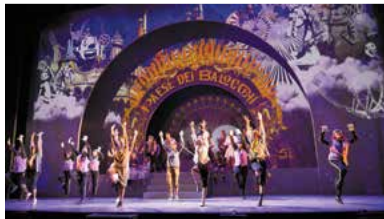
Moment de l'obra 'Pinocchio' de la Joventut de la Faràndula.