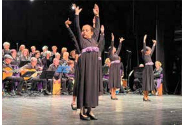
El cos de ball de 'Pasió Flamenca' tenia membres de totes les edats. || J. G.

Més d'una vuitantena de persones entre cantants, músics i ballarines (i algun ballari) i un narrador van posar-hi grans dosis de respecte, estimació i duende per portar a l'escenari de l'Auditori Municipal Miquel Pont ni més ni menys que Pasió Flamenca . I ho van fer amb gran èxit. Tant les llàgrimes d'emoció vessades per diversos espectadors que vam omplir de gom a gom l'Auditori com dels mateixos artistes així ho van palesar. La càrrega emocional va ser molt forta: traslladar l'esperit de la Set-