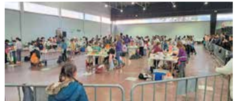
Moment de la trobada de cuiners a Colònies i Esplai Xiribec a l'Espai Tolrà. || CEDIDA

Tots els participants van rebre un obsequi; un tallador de diferents formes per poder fer plats amb ous durs. + || M. ANTÚNEZ