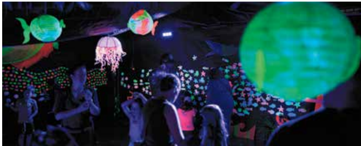
Imatge d'arxiu de la Marató per la Diversitat de Suma Castellar de l'any passat.