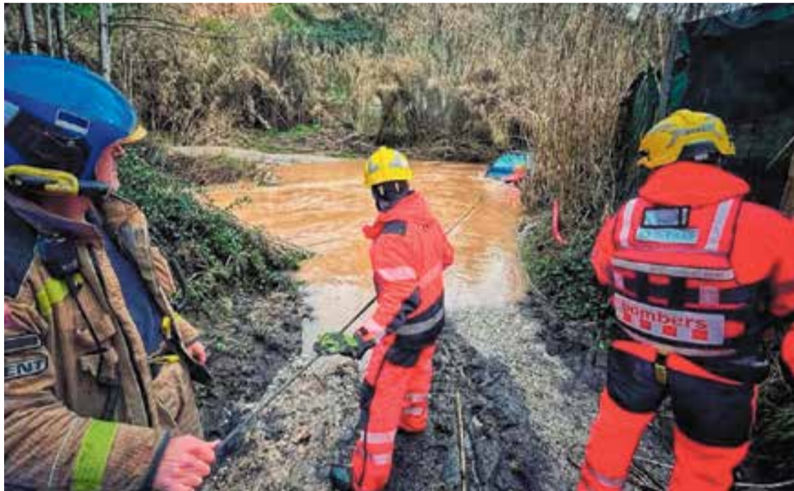
Els Bombers rescaten un vehicle a la zona del Rieral diumenge al matí.

Les intenses pluges del cap de setmana va causar alguns problemes a la xarxa viària divendres a la tarda. Cap