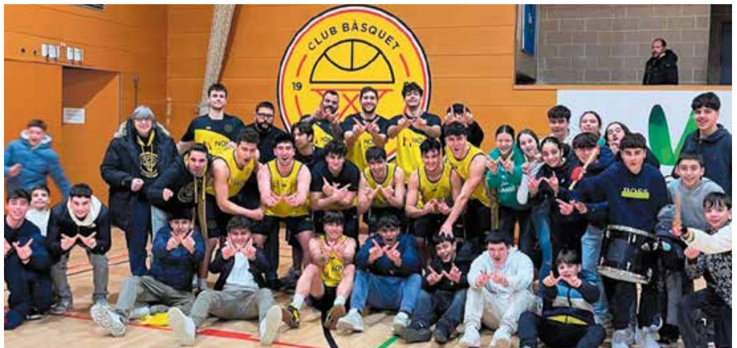
La comunitat entre equip i afició està creixent juntament amb els èxits del club groc-i-negre després d'una època en què l'equip ha tocat fons.

I els resultats esportius ajuden. La bona situació dels dos sèniors està fent tornar a l'afició a la grada del Puigverd i tornar a la comunitat d'anys enrere. Jugadors i jugadores de la base comencen a vibrar amb els dos primers equips –són una generació que encara no ha conegut els èxits groc-i-negres– i cada vegada més la situació veu la llum de sortida del túnel per tornar a créixer.