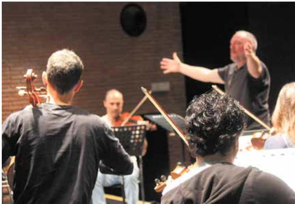
Assaig de la Kamerata Castellar, que ofereix la seva tercera proposta aquest divendres i dissabte.

A la primera part del concert, que tindrà lloc dissabte, a les 20 h, s'interpretaran tres simfonies expressament escrites per a corda d'aquest compositor: "Són les simfonies 1, 4 i 10 d'una sèrie de 12 que ell va escriure quan era molt jove, dels 14 als 16 anys, és increïble", diu Miró. A la segona part del concert, es podrà