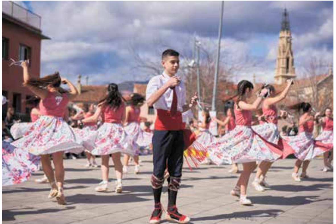
Ballada de l'entitat del Ball de Gitanes a la plaça Major celebrada el mes de març de l'any 2024.

En el marc de la celebració del cinquantè aniversari, el Ball de Gitanes va iniciar -i va allargar fins al 27 de març-, una gimcana de Gitanes, posant vestits als aparadors de les botigues. L'objectiu era que tothom qui els veiés, agafés el díptic que hi havia a la botiga i respongués correctament a les preguntes que s'hi plantejaven. Les respostes tenien premis en forma de vals per bescanviar en comerços de l'associació Comerç Castellar. ➔