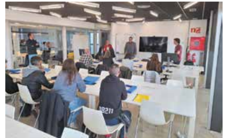
Benvinguda als alumnes de fabricació digital i disseny 3D. || AJUNTAMENT

Pel que fa al taller de fabricació digital i disseny 3D, es tracta d'una formació de 90 hores que permetrà als alumnes adquirir coneixements sobre disseny digital 2D i 3D, així com sobre el funcionament i l'ús de tecnologies de fabricació digital, com ara la impressió 3D, el tall làser i el tall de vinil. El taller està estructurat en dos mòduls i s'impartirà fins a principis de maig al LAB Castellar. + || REDACCIÓ