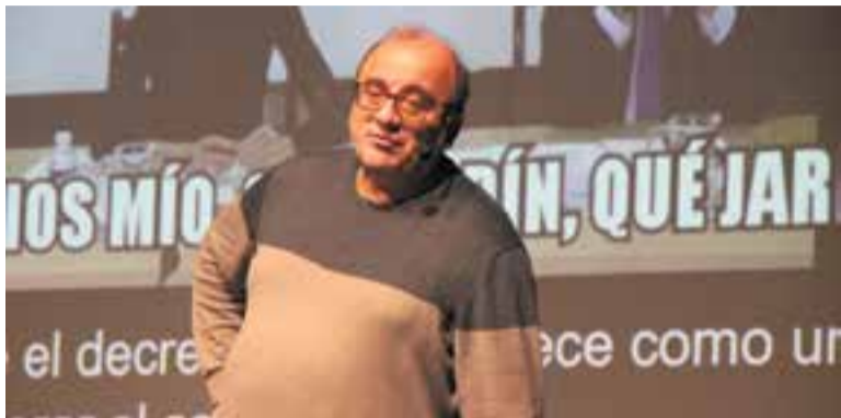
L'investigador Antonio Turiel a la conferència de L'Aula, dimarts passat.

L'investigador científic del CSIC, matemàtic i doctor en física Antonio Turiel va passar dimarts passat per L'Aula amb la ponència Crisi de sostenibilitat: La urgent necessitat d'un canvi . L'investigador va oferir una fotografia sobre l'escenari dels combustibles fòssils, “que estan en decadència” i de les energies renovables. “La transició cap al model 100% renovable no és discutible”, va dir Turiel. “És necessària, ineludible i urgent”. Tanmateix, l'especialista va assegurar que la producció massiva d'electricitat a través d'energia renovable “no funciona i provoca una gran destrucció ambiental sense benefici energètic i social”. Turiel va proposar un model de transició eficient que inclogui “una relocalització intensa de l'activitat econòmica i industrial”. I va afegir: “Cal una disminució metabòlica de la societat, en consonància amb els límits ambientals i materials”. Però l'investigador considera que el canvi a un model més sostenible, que no es basi en el creixement, “no és possible sense una reforma del sistema social i econòmic, i un canvi radical dels valors culturals”. “Una altra transició energètica és possible”, va sentenciar Turiel, “però hem de superar el capitalisme”. + || ROCÍO GÓMEZ