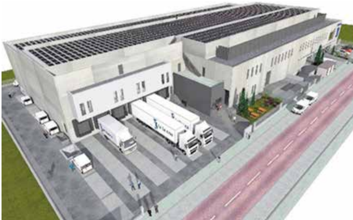
Simulació de com serà el centre logístic de La Sirena al polígon del Pla de la Bruguera. || LA SIRENA

El Pla de la Bruguera ja acull les obres que inclouen un megacongelador de 4.000 metres quadrats