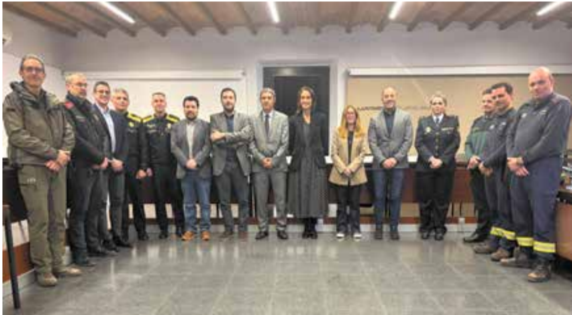
Els membres de la Junta Local de Seguretat a Ca l'Alberola.