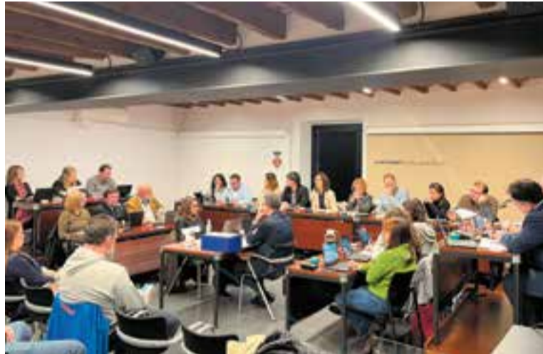
Imatge del ple municipal de març, dimarts passat. || A. T.

Creus va apuntar que aquests habitatges s'adrecen a perfils familiars molt concrets, “com gent gran, joves que s'emancipen o famílies amb menys recursos que no sempre tenen vehicle i que no poden assumir sobre costos innecessaris” . L'objectiu és, per tant, fer més econòmic i viable el projecte constructiu perquè, a més, “l'experiència demostra que sovint aquestes places d'aparcament queden buides” .