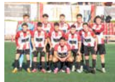
L'Argentona, un altre líder que no va sortir viu del Joan Cortiella. || UE CASTELLAR