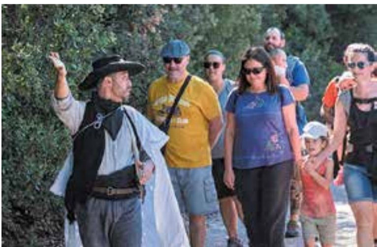
Un moment de la representació d' Emboscada, un viatge pels 5 sentits .

La Xarxa de Parcs Naturals de la Diputació ofereix una experiència que combina natura, història i expressió artística a través d'una sèrie de rutes teatralitzades en tres dels seus espais naturals. Aquest format innovador permet descobrir la història i la biodiversitat dels parcs mitjançant el llenguatge simbòlic del teatre. A més, els itineraris estan pensats per a tots els públics i compten amb recursos d'accessibilitat, com interpretació en llengua de signes catalana (LSC), audiodescripció per a persones cegues, barres direccionals i serveis de cadira Joëlette. En el cas del Parc Natural de Sant Llorenç del Munt i l'Obac es representa Emboscada, un viatge pels cinc sentits , que té com a protagonistes el bandoler Capablanca i l'Ermesinda, la pubilla del mas dels Ubach. L'activitat que es desenvolupa a la Casa Nova de l'Obac, a la carretera de Terrassa a Rellinars, i és gratuïta, encara que s'ha de fer reserva contactant al correu rutesteatre@diba.ca . +|| REDACCIÓ