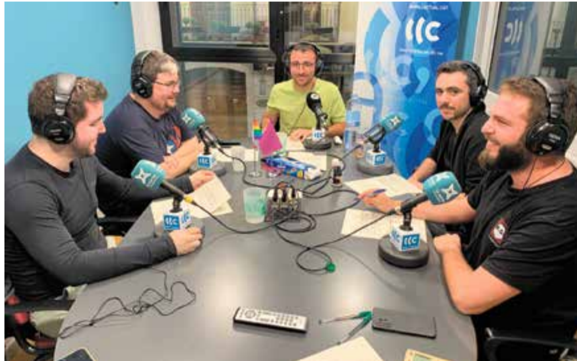
Imatge d'un programa d'aquesta temporada d' A les portes de Troia . || L'ACTUAL

A les portes de Troia es manté a l'antena de Ràdio Castellar de forma ininterrompuda des del 2014 i, de seguida, va començar a atraure l'atenció d'altres emissores locals i municipals, que van