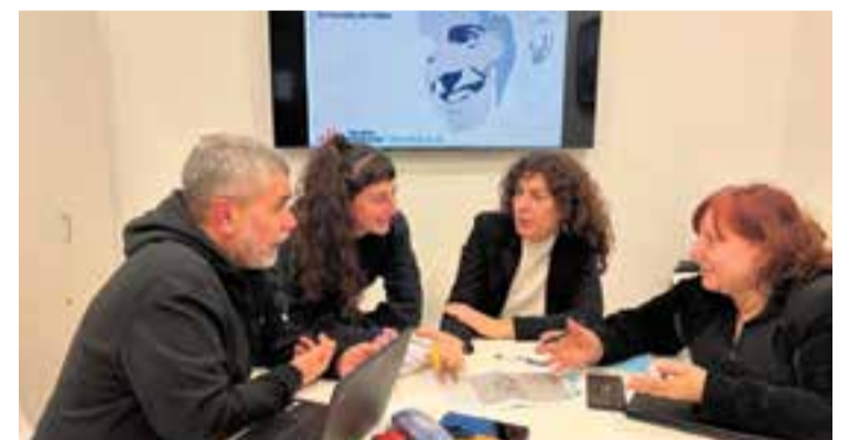
El grup d'ERC en una reunió organitzativa de la Beca Papell.