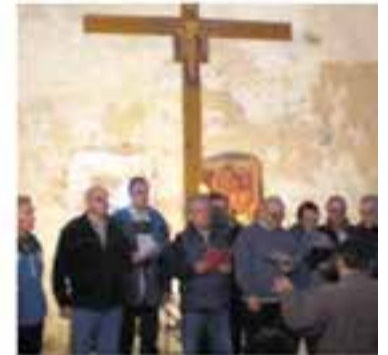
Cor de Cavallers

+ INFO: a/e info@pistol.cat, www.pistol.cat/re-connecta