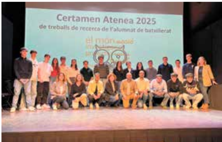
Foto de família dels alumnes guardonats, amb tutors i representants polítics.

Els projectes locals estan relacionats amb art, ciències, salut i tecnologia