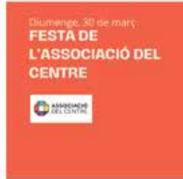
Associació del Centre

+ INFO: tel. 616439985 a/e laicavot.teatre@gmail.com