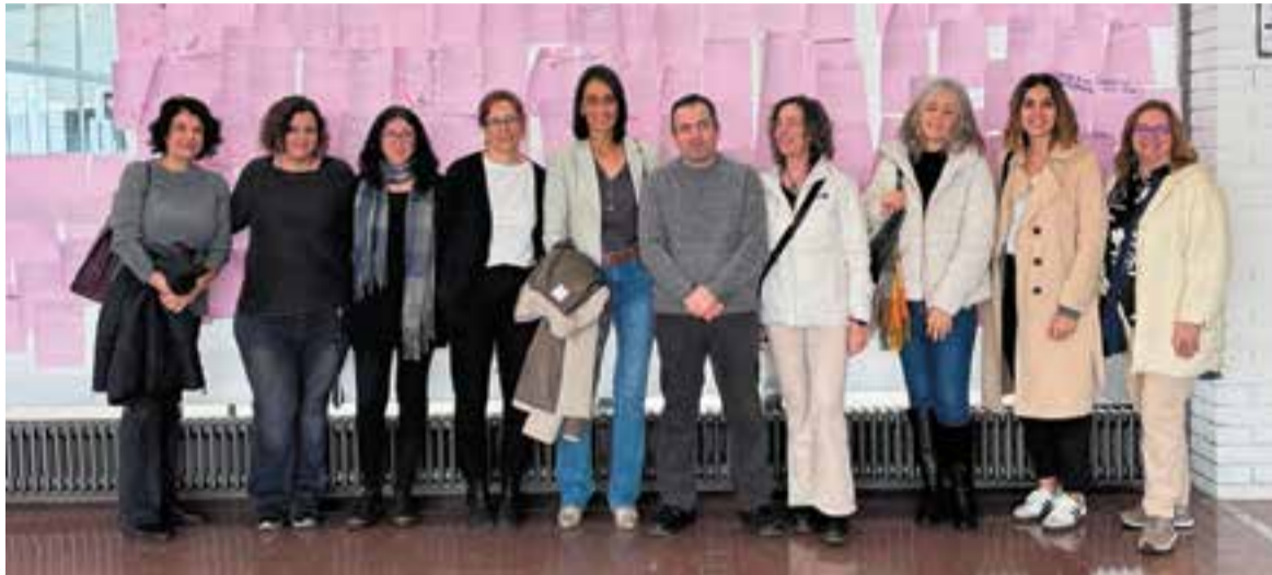
L'equip directiu de l'INS Castellar amb la directora de Serveis Territorials i l'alcalde de Castellar.

Castellar amplia les opcions formatives amb un grau que s'adreça a joves a partir de 15 anys