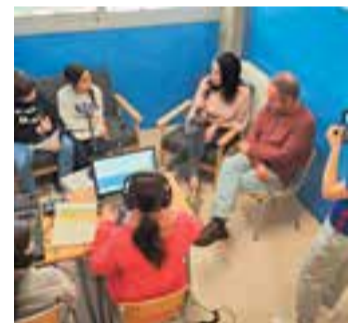
L'estudi de ràdio.