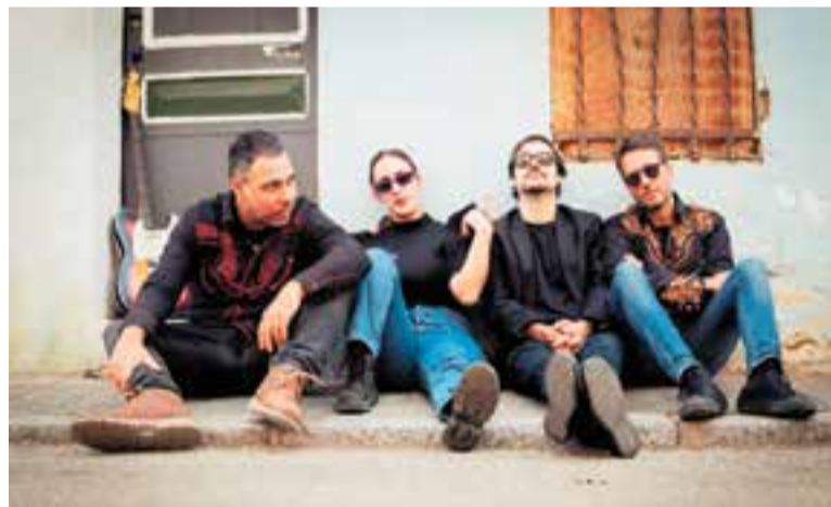
Alice & The Wonders actua divendres 21 al Calissó.

permetre treure la bèstia que duia a dins” . Ara ja ha fet més de 2.500 concerts i “per a mi, ha estat una teràpia, per créixer com a persona, també” .