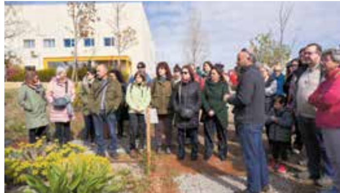
Una visita al jardí de Les Garberes durant la fira de l'any passat.