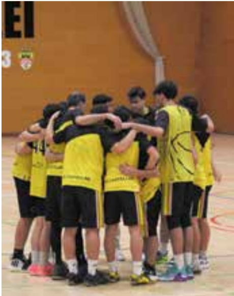
2 de 3 contra els primers classificats.

El CB Castellar masculí comença a funcionar bé, un aspecte que va comprovar de primera mà el Martinenc B, al qual van superar per 89-55. El femení perd la imbatibilitat en Lliga, després de caure amb el CN Sabadell per només tres punts.