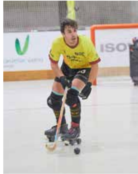
L'HC Castellar no va poder amb el Caldes.

Segona derrota consecutiva de l'HC Castellar, aquesta vegada en el derbi de Vallesos a Caldes de Montbui (5-3), entre segon i tercer classificats. Tot i dominar en la primera part, sent molt superiors als locals (1-3), el Recam Làser Caldes va saber moure millor la banqueta en la segona, per imposar-se a un cansat Castellar, sense rotacions.