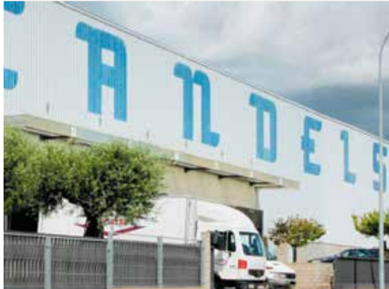
Imatge d'arxiu de la seu de Candelsa al polígon del Pla de la Bruguera.

D'altra banda, des de Candelsa subratllen que “amb aquesta adquisició, Miró, que té 22 botigues físiques i una sòlida presència en línia a través de www.miro.es, passa a formar part integral de la nostra empresa, que es consolida com una de les forces més potents al mercat”. I afegixen que: “Miró té gairebé 50 anys d'història i s'ha destacat pel seu ferm compromís amb la sostenibilitat, l'atenció personalitzada als clients i ara, amb el nostre suport, estem a punt per portar la marca a noves altures”.