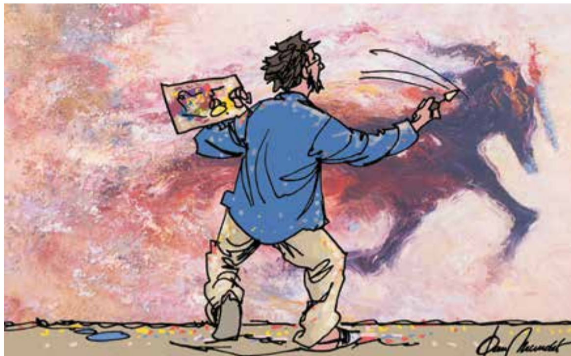
© "The emperor's new clothes" - Sinéad O'Connor.

gine", composta per John Lennon i Yoko Ono, m'ha estat motivant infinitat de vegades sense que, a dia d'avui, mai l'hagi deixat d'escoltar fins al final sense distreure-me'n. No va ser, però, fins passat un bon temps des que es va publicar el 1971, que vaig posar atenció a la lletra, cosa que em passa sovint amb les cançons de llengua anglesa, ja que les muses en aquest cas sempre miren cap a una altra banda. En una estrofa de la cançó, John Len-