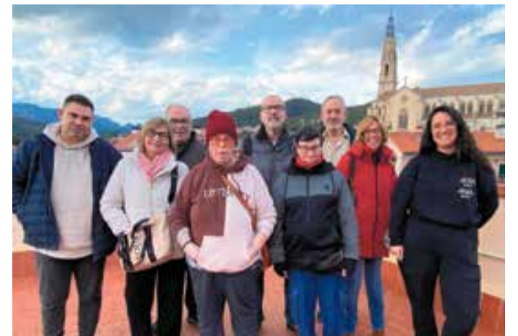
L'equip del programa 'Ràdio Club Social', que s'emet a Ràdio Castellar. || R. G.

Val a dir que Suport Castellar es prepara per a una primavera farcida de projectes i de propostes culturals. Per començar, participaran en la Fira d'Entitats de la diada Sant Jordi, amb una paradeta per donar a conèixer totes les activitats d'aquesta entitat que treballa en l'àmbit de la salut mental. Amb motiu de la celebració de Sant Jordi, durant el mes d'abril els membres del Club Social visitaran diverses escoles de primària de Castellar per oferir una lectura de poemes d'autors catalans als alumnes de 1r i 2n de primària. + || ROCÍO GÓMEZ