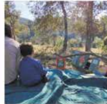
Associació Pedagògica Pistil