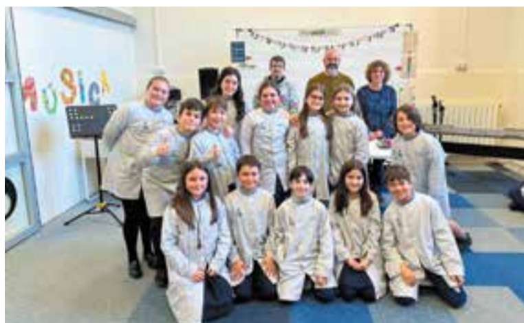
Lectors de 4t de primària de FEDAC, amb els membres del jurat.

La fundació va crear el certamen per fomentar el gust per una lectura que potenciï la fluïdesa, el ritme, l'entonació, la postura corporal i l'expressivitat dels petits lectors. El pri-