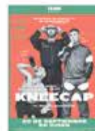
Ds. 22/02 – 21.30 h Kneecap