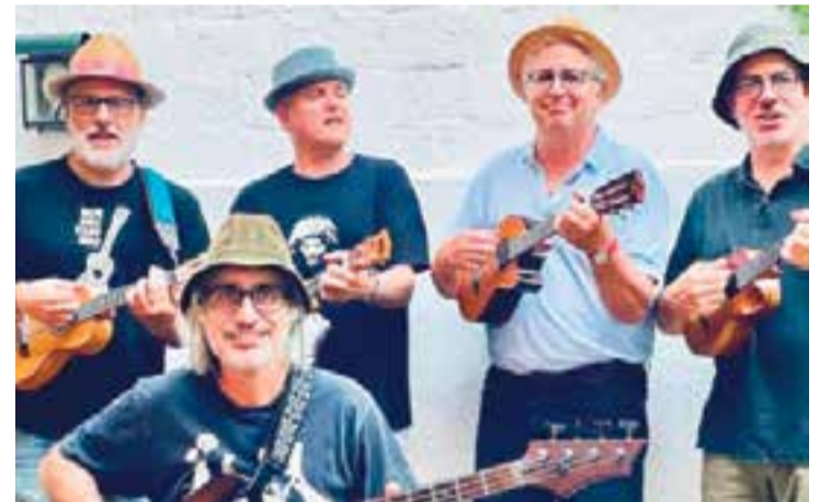
Els Tukemuke actuen divendres al Calissó Cultural.

Si a tot això hi afegim que el seu repertori inclou cançons folk, pop i rock que tots coneixem de grups com, per exemple, Queen, The Blues Brothers o The Proclaimers, la diversió està assegurada. + || M. A.