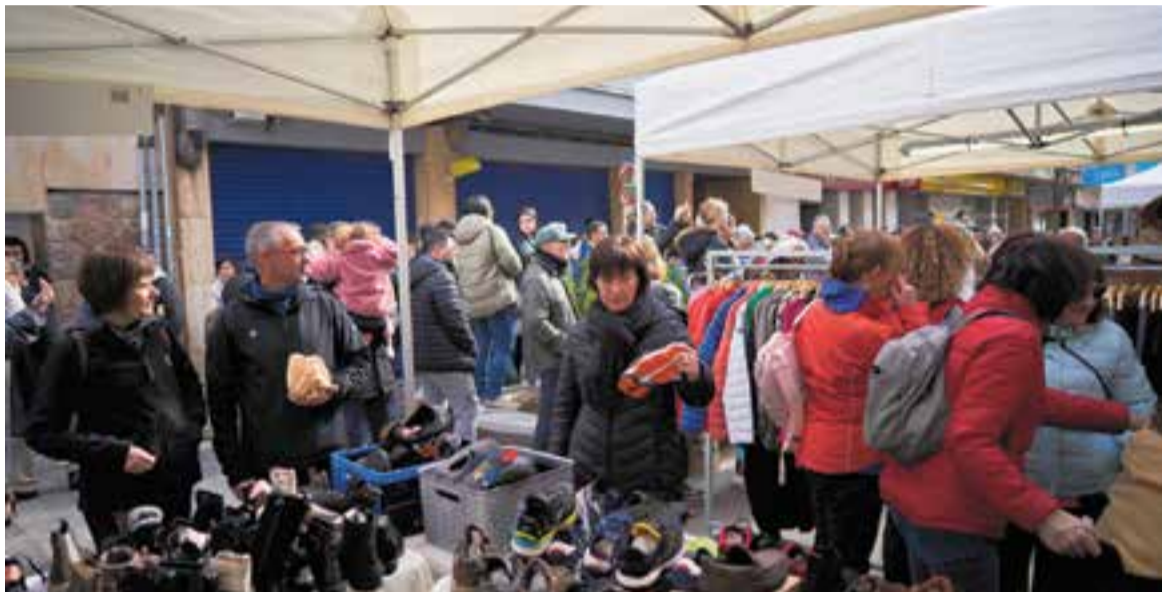
Diferents parades de roba i de calçat de la Fira Fora Estocs de l'any passat. || Q. PASCUAL

Hi haurà 35 parades entre els carrers Sala Boadella, Hospital i Montcada i animació infantil