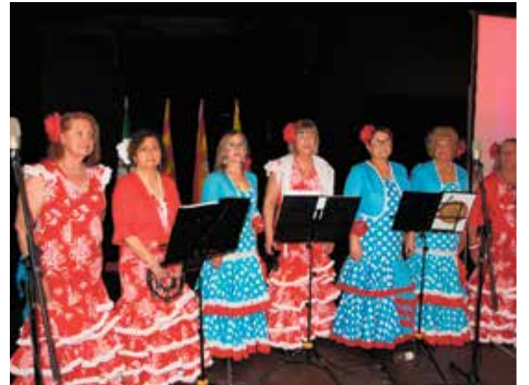
L'actuació del Coro Aires Rocieros Castellarencs l'any passat.