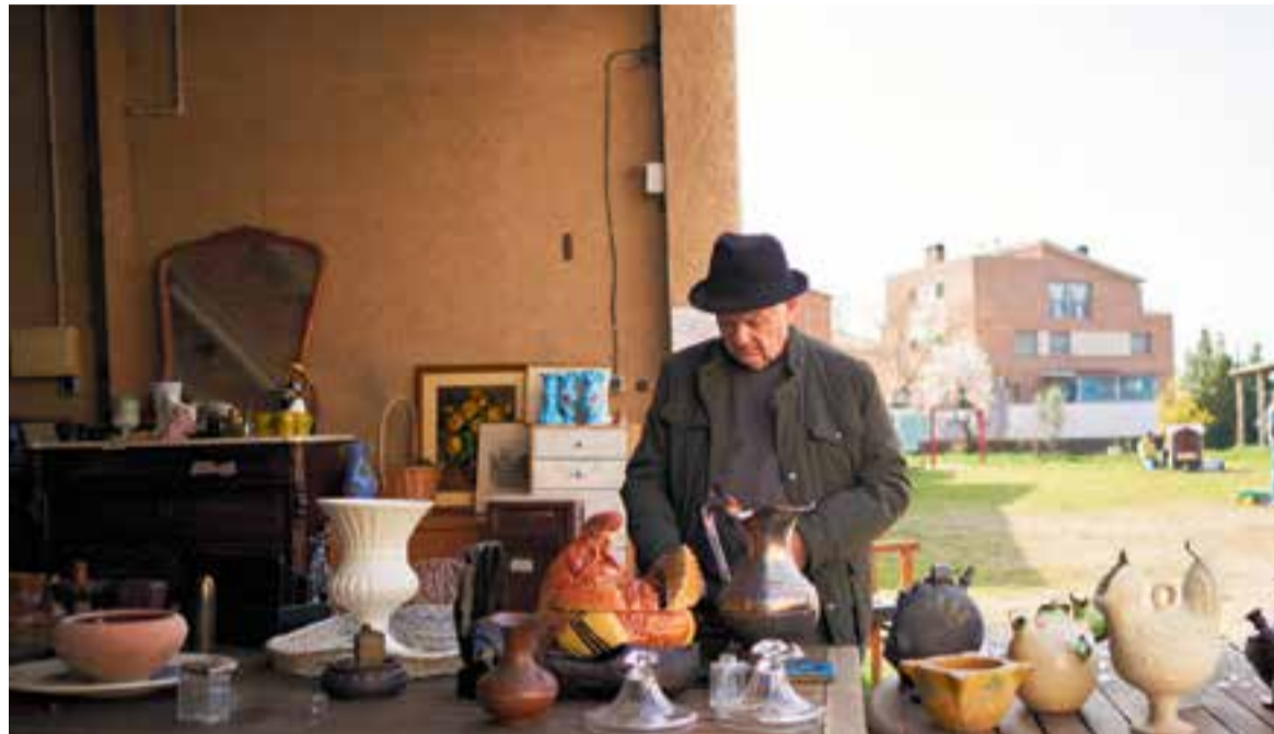
Els visitants a Els Encants de Can Carner podien triar entre diferents objectes entre mobles, ceràmica, llibres o roba.

Els que es va exposar diumenge passat davant la masia de Can Carner és el que no han pogut aprofitar els socis per als seus espais privatis i comunitaris. La compra es feia per taquilla inversa: “La gent ofereix un preu a les persones de la coo-