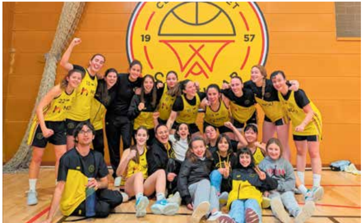
Onze victòries consecutives –d'un total de 14– en el debut a Primera Territorial és una xifra estratosfèrica pel CB Castellar.