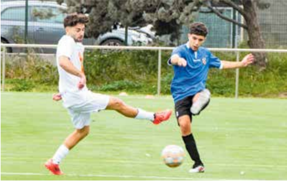
La UE Castellar va tornar a topar amb la mateixa pedra: un arbitratge lamentable.