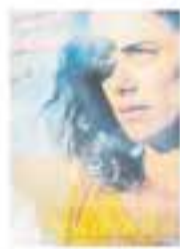
Dv. 21/02 – 18 h Los destellos