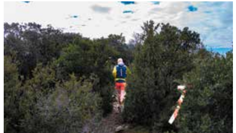
Un participant de l'edició 2024 de la Corriols al Pic del Vent. || A. S. A.