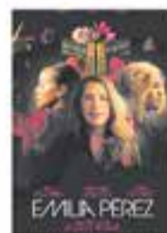
Dg. 23/02 – 21 h Emilia Pérez