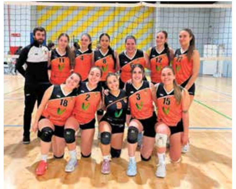
L'equip femení de vòlei continua en primera posició del play-out.

Amb el 3-2 (22-25/25-20/26-24/21-25/15-8) aconseguit contra el CV Salou, retallen a quatre punts la diferència amb la zona de salvació, encara amb marge.