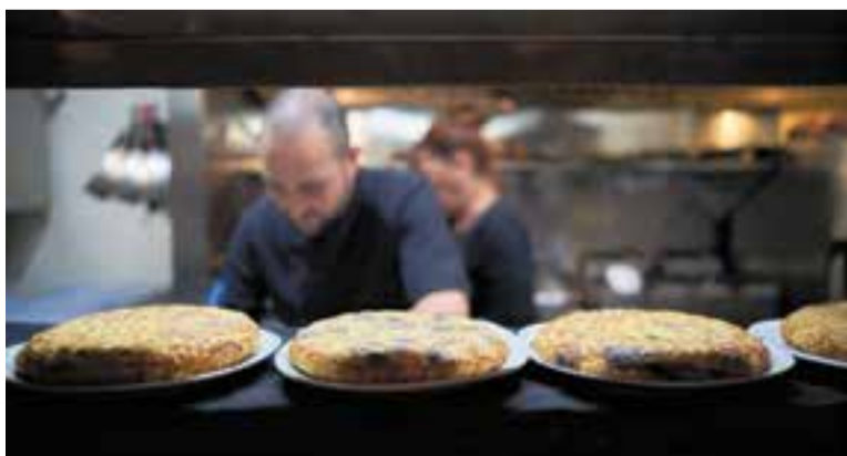
Un dels restauradors participants del Corretruits, precursor del Truitàpa't.

Durant tres dies, la ciutadania podrà recórrer els locals per tastar les seves propostes