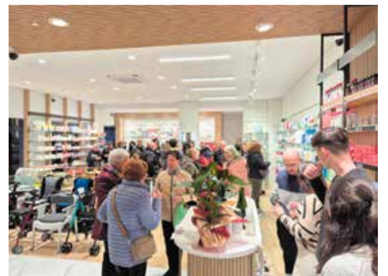
Una imatge de la inauguració del nou establiment.