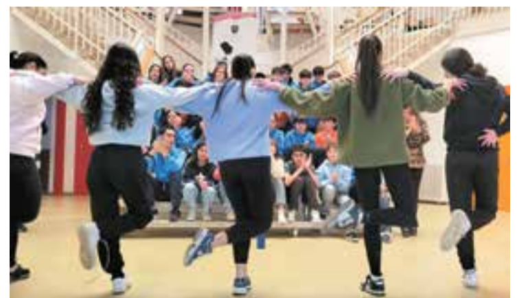
Diferents alumnes xipriotes ballant danses tradicionals a El Casal.

L'escola El Casal ha rebut recentment una visita d'estudiants i professors de l'escola Palouriotissas Gymnasium de Nicosia, Xipre. Aquest intercanvi promou una gran experiència multicultural, i durant la seva estada, els alumnes xipriotes han pogut viure una setmana de convivència amb les famílies dels estudiants del Casal. Els participants en aquest projecte d'intercanvi han estat allotjats a les cases dels estudiants del Casal. A més, els alumnes i professors de Xipre han tingut l'oportunitat de conèixer llocs emblemàtics de la nostra geografia, així com d'aprofundir en les nostres tradicions i costums. Com a part del projecte, els estudiants del Casal viatjaran pròximament a Nicosia. + || REDACCIÓ