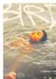
Dv. 21/02 – 21 h Bird