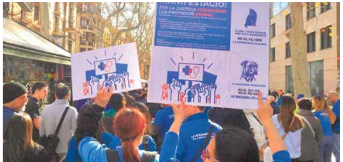
El col·lectiu també demana la rebaixa del 21% d'IVA veterinari. Imatge de la manifestació a Barcelona de fa uns dies.

A partir d'ara, els veterinaris ja no poden dispensar medicaments a la consulta si no són d'aplicació directa en l'animal, ni prescriure una dosi exacta, un tractament individualitzat. La nova legislació limita la venda directa de medicaments a les farmàcies, que hauran de dispensar l'envàs