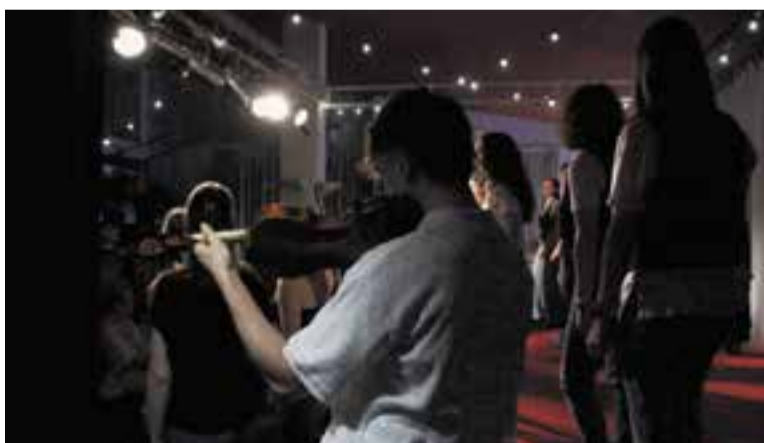
Assaig de diversos músics de Llum a Escena.

Aquest cap de setmana, l'associació Llum a Escena presenta el concert Ànimes flotant a la Sala de Petit Format de l'Ateneu, en concret, dissabte 22, a les 20 h, i diumenge 23, a les 12 h i a les 18 h. Les protagonistes seran les corals de l'escola de música i teatre Espaiart de Castellar del Vallès.