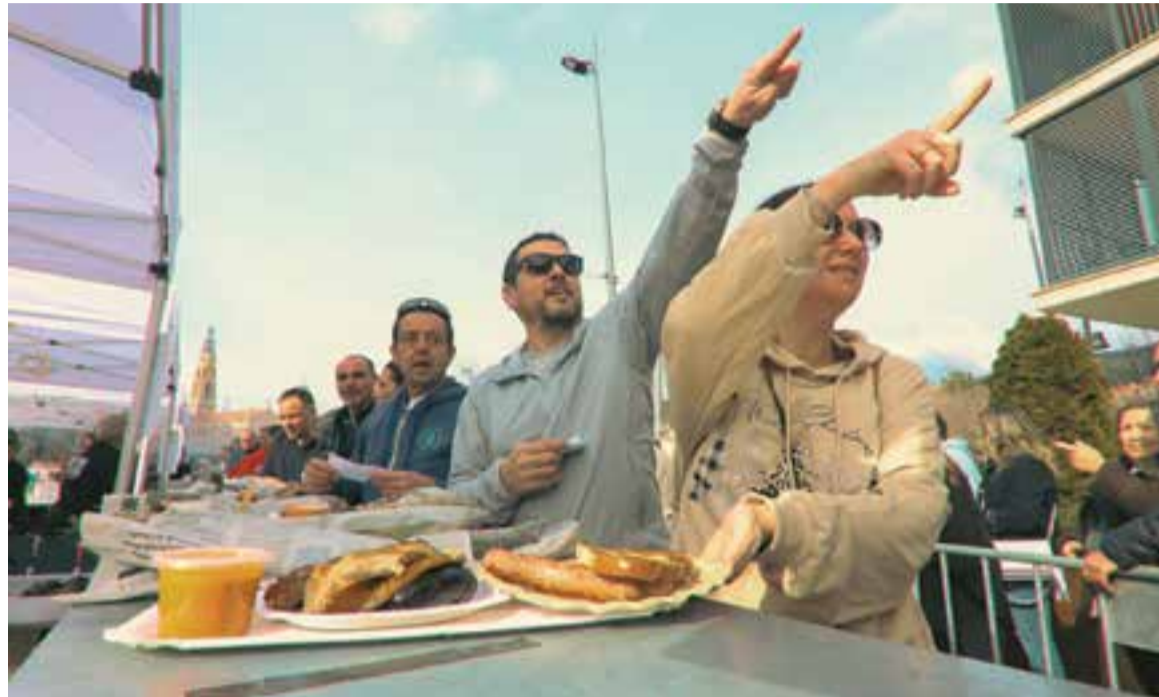
El 9 de febrer passat es va organitzar una calçotada per part de Comerç Castellar que va atraure un miler de persones.

Aquestes dades de treballadors, tal com assenyalen des de l'Observatori Comarcal, aporten una foto fixa que representa el 27,4% del total del teixit productiu de Castellar del Vallès. Per tant, el pes de l'hostaleria i el comerç està per sobre de la mitjana catalana, que és del 24,5%, i a un nivell lleugerament superior al del Vallès Occidental (27,1%). Si comparem Castellar amb altres municipis vallesans podem comprovar que el pes d'aquest sector econòmic és lluny del de municipis com Sant Quirze del Vallès (36,6%) però similar al