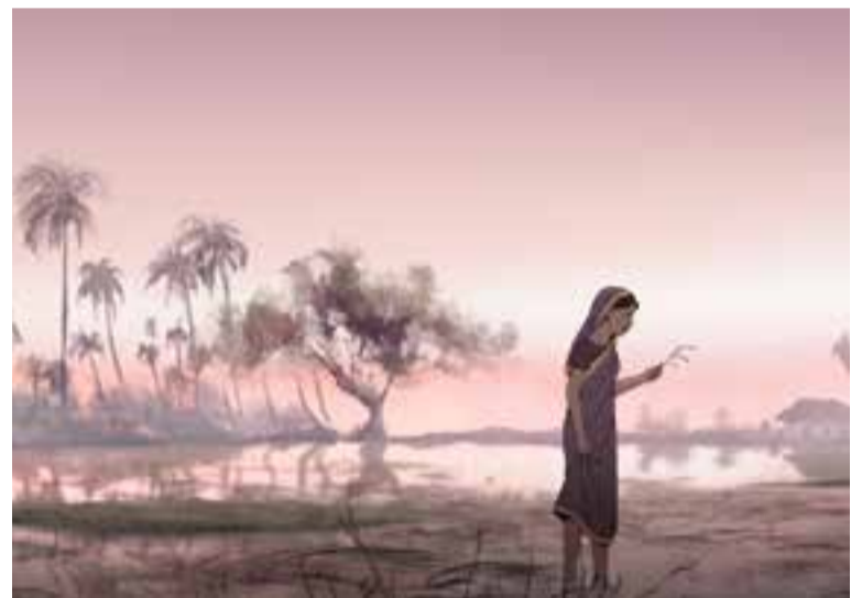
Imatge de la pel·lícula d'animació 'Papallones negres', que tracta sobre els refugiats climàtics, i que es projectarà aquest diumenge a les 11.30 h al BRAM!.