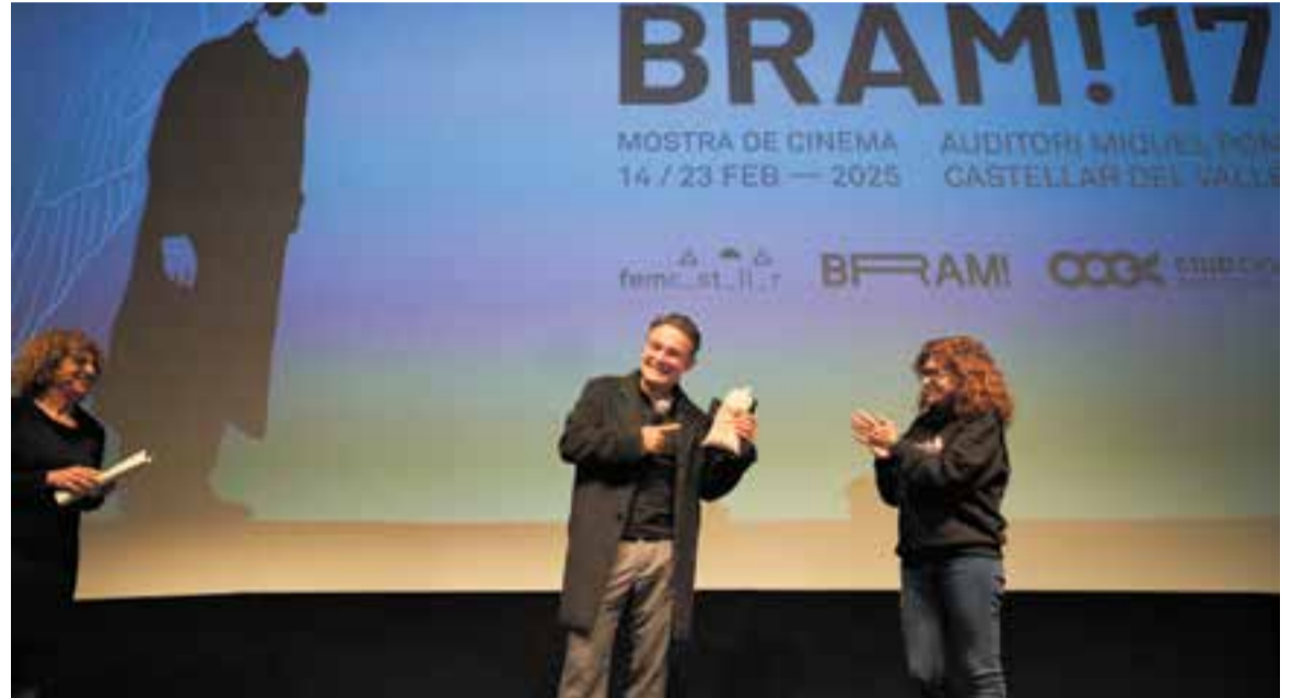
L'actor Urko Olazábal recollint el sac de mongetes del ganxet de la Mostra de Cinema de Castellar BRAM!.

Per això, l'actor base va assegurar que va haver d'aprendre "a mirar a través de les ulleres d'un psicòpata, narcisista, abusador i maltractador" perquè en el moment que una persona que sap que està fent el mal "el continua fent i no li importa, per a mi no té cap altre