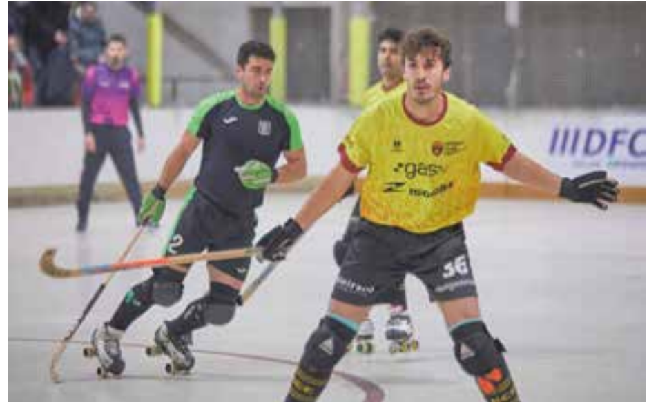
L'HC Castellar perd els quatre punts de renda i ara té el Bell-lloc a un, i el Sant Cugat i el Caldes a dos.

Una setmana després d'ampliar a quatre punts l'avantatge sobre el Bell-lloc, una derrota a Sant Celoni (4-3) dilapida la diferència al capdavant de la classificació. L'HC Castellar està obligat a sumar de tres en tres si no vol perdre el lideratge.