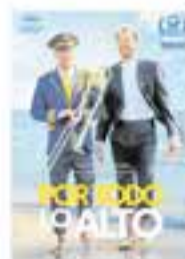
Dg. 23/02 – 18 h Por todo lo alto Preestrena