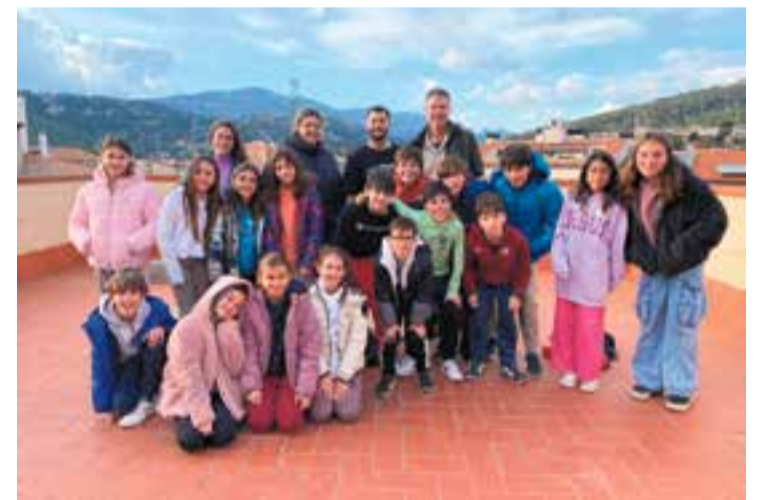
Alumnes de l'Escola El Sol i la Lluna durant la seva visita a la ràdio. || R. GÓMEZ

Un grup d'estudiants de l'Escola El Sol i la Lluna van visitar dijous passat a la tarda els estudis de Ràdio Castellar. Els alumnes, que són del 4t, 5è i 6è de primària, es troben immersos en la preparació del pòdcast On air , un projecte que s'emmarca en el taller de ràdio del centre escolar, que s'emetrà a Ràdio Castellar i es podrà recuperar a l'espai de pòdcast de lactual.cat . No és la primera vegada que els alumnes aposten per aquest tipus d'activitat i que col·laboren amb l'emissora municipal. Abans de la gravació, van voler conèixer les instal·lacions de Ràdio Castellar i L'Actual per copsar el funcionament del mitjà i descobrir com ha evolucionat la ràdio des dels seus inicis tot capbussant-se en la col·lecció de vinils, i fer una primera incursió als estudis radiofònics de la 90.1 FM. ✦ || R. GÓMEZ