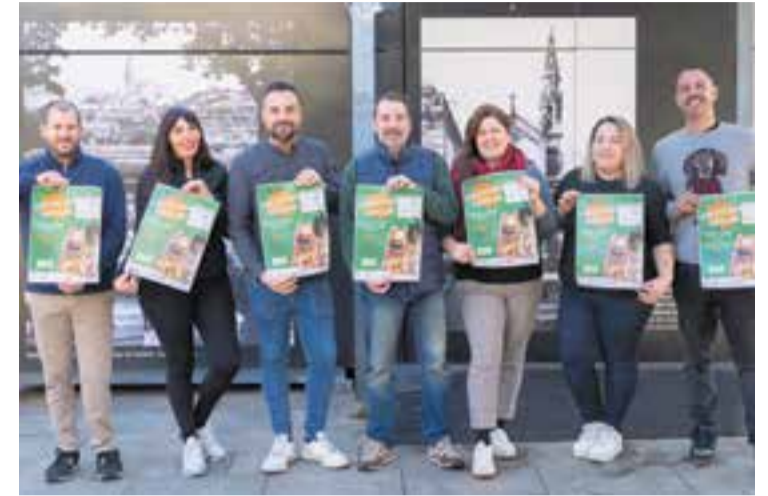
Els restauradors participants en la calçotada popular del 2 de febrer.