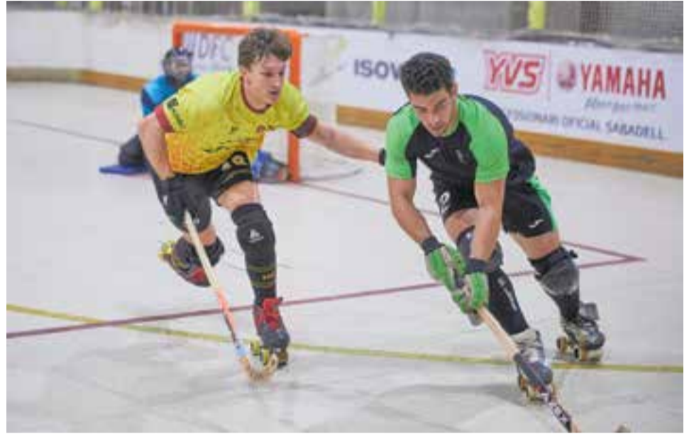
Els grana no van poder frenar l'ímpetu del Lloret en l'últim minut i van volar dos punts. || J. VINYETS

Empat del Nacional Catalana de l'HC Castellar, que no va poder superar el Lloret en l'inici de la segona volta (3-3). Un partit que es va escapar en l'últim minut amb la igualada visitant. Els de Fiti empaten al Dani Pedrosa, però mantenen els quatre punts de diferència contra el Bell-lloc, que també va igualar a un amb el Vila-seca. El Sant Cugat va caure per 5-1 contra el Voltregà, que puja fins a la tercera plaça.