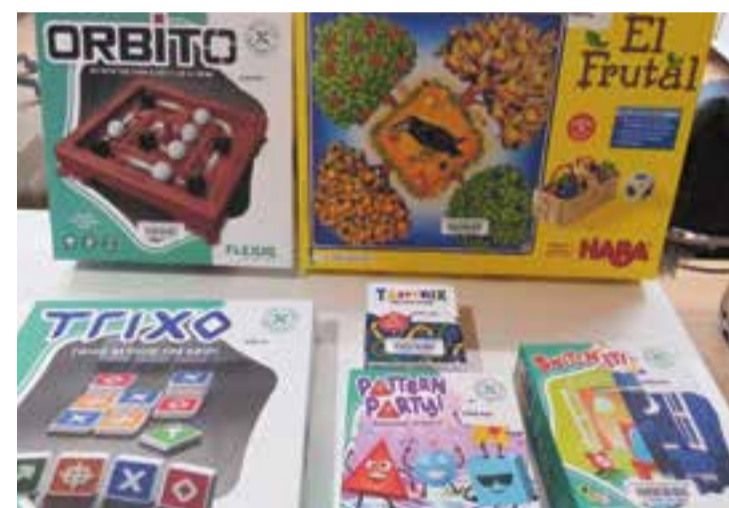
Alguns dels jocs que la Biblioteca Antoni Tort ofereix en préstec. || CEDIDA

També es podran agafar en préstec amb el carnet de biblioteques de la Diputació. + || REDACCIÓ