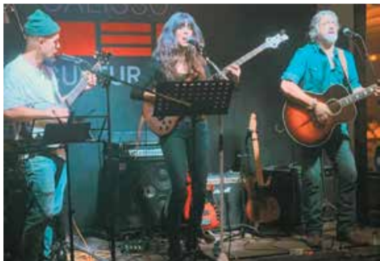
Wild Rosemary actua dissabte al Centre Feliuenc de Sant Feliu del Racó.

El projecte push! ( Empeny! ) comença i acaba diumenge però té un format que permetria fer-lo a altres comunitats i poblacions amb cors. "És un projecte bonic que explica una història bonica i que té un missatge final esperançador", afegeix Coma. +