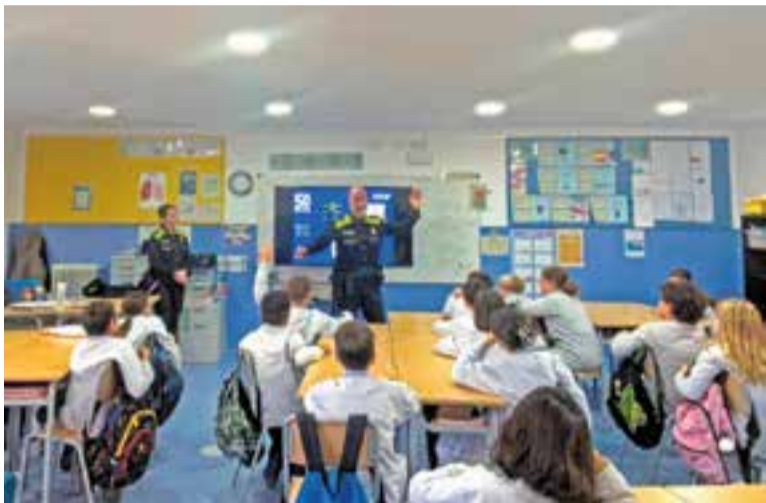
Agents de la policia local impartint la formació teòrica.

La formació es completarà amb un circuit de bicicletes a l'Espai Tolrà