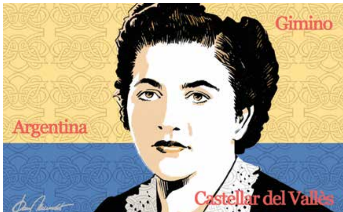
© La Nonna. || JOAN MUNDET

"Castellar del Vallès, aquell racó que em va regalar albades plenes de pau en els meus últims dies"