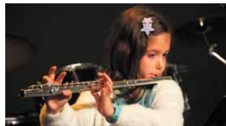
Una de les alumnes d'Espaiart, durant les audicions de dissabte. || CEDIDA

Les audicions van començar dissabte passat a la Sala de Petit Format de l'Ateneu. Es van fer tres sessions que van acollir tota mena d'instruments i d'interpretacions, des del piano, la bateria, l'ukulele, la flauta travessera, la guitarra, la trompeta, el violí o el violoncel, amb un repertori molt divers de cançons populars, cançons de pop-rock o clàssics com el Preludi op. 28, núm. 4 en mi menor de Frédéric Chopin, acompanyades d'imatges que es projectaven, "un dels moments més emotius de la jornada, amb una peça que es va interpretar per commemorar els vuitanta anys del final de la Segona Guerra Mundial, que ens va recordar el poder de la música per transmetre emocions i connectar amb el passat" . + || M. ANTÚNEZ