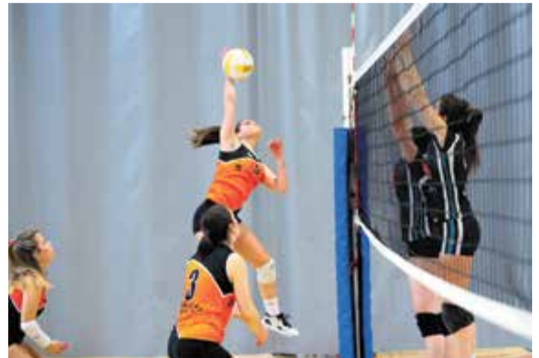
El femení encara té opcions d'aconseguir la classificació per al play-off. || M. CASALS

El femení, per la seva banda, també va perdre, i ho va fer per 1-3 enfront del Sagrat Cor de Sarrià. Una victòria hauria situat les de Jordi Domènech en posició de promoció d'ascens, ja que el Viladecans va caure també per 3-1 a Alpicat. En l'última jornada, les de Domènech estan obligades a superar per 0-3 el Jaume Balmes i esperar una difícil derrota del Màgic Viladecans contra les cueres del Vikings Prat. + || A. SAN ANDRÉS