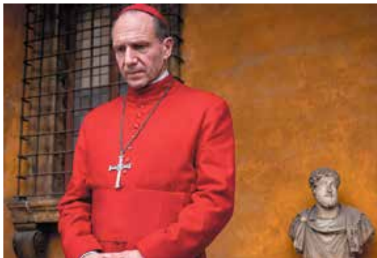
'Cónclave' és una de les pel·lícules programades a la 17a edició del BRAM!.

Els abonaments per assistir a les projeccions de la 17a edició de la Mostra de Cinema de Castellar del Vallès BRAM! es posen a la venda aquest divendres, a partir de les 12 h, al web de l'Auditori Municipal https://auditori-castellar.cat/ .