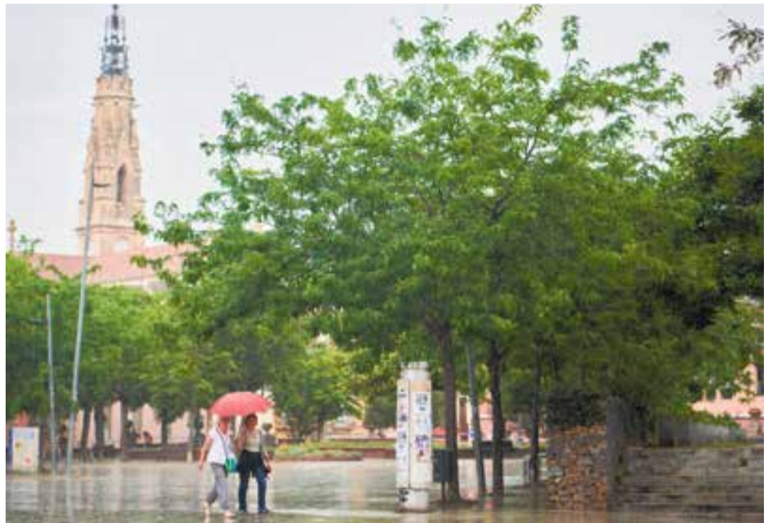
Dues dones caminant sota la pluja, a la plaça Major, l'abril de l'any passat, mes que va ser força plujós.

El 2024 ha tornat a ser un any càlid amb una temperatura mitjana de 16,5 graus, més d'un punt per sobre de la mitjana històrica. “La temperatura mitjana de l'any ha estat clarament més alta que la mitjana, que és de 15,5 graus” ,