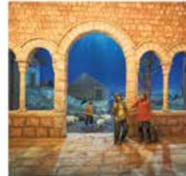
Grup Pessebrista de Castellar

+ INFO: www.castellarvalles.cat/castellarvalles.cat