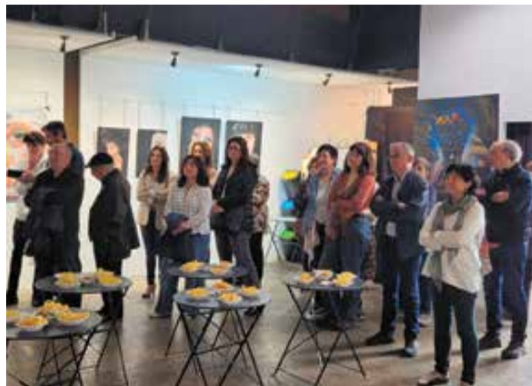
Vermut amb motiu de l'exposició de Bonanad-Massagué, ara fa nou mesos.

Diuenge 26 al migdia, s'ha programat un altre vermut, en