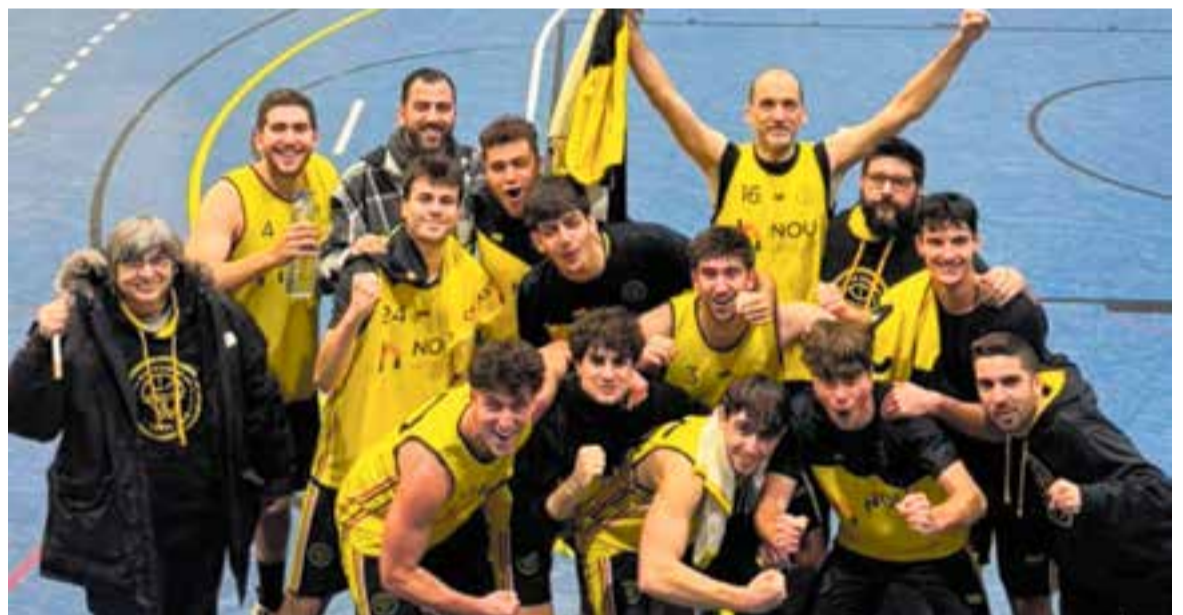
A dalt, un instant del partit del femení al Puigverd. A sota, el masculí celebra la victòria a Barcelona.

La publicitat no és cara. Només costa diners.