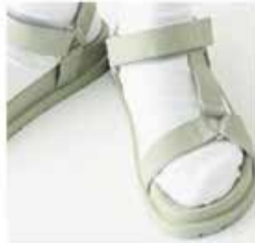
Esbart Teatral de Castellar

+ INFO: tel. 639129327, Instagram @calcalisso