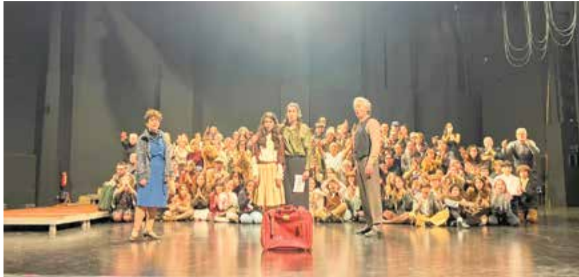
Moment de l'assaig de l'òpera 'Push!' ('Empeny!'), que s'estrena diumenge a La Faràndula de Sabadell.

Aquest tren anava destinat a la mort. "La seva mare li va fer