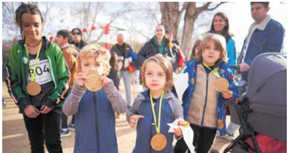
Quatre dels infants que van participar en una de les curses amb les medalles de 'finishers'.