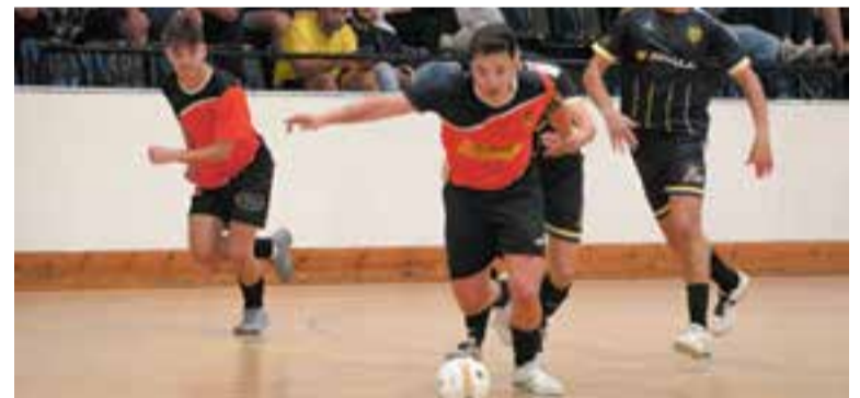
L'FS Castellar va aconseguir un empat (4-4) a la seva visita a Terrassa. || CEDIDA

El dissabte (20.15 h), els d'Hernández s'enfronten al Frederic Mistral, cinquè classificat, en la recerca d'una nova victòria que doni estabilitat a l'equip. + || A. SAN ANDRÉS