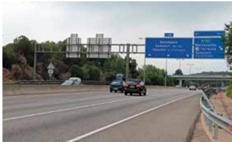
Un tram de la Ronda Oest, on connectaria la Ronda Nord.

El consistori de Sabadell proposa construir un túnel per sota del rodal d'1,2 quilòmetres per salvar els camins existents i un altre d'1 quilòmetre a l'avinguda de les Palmeres fins a arribar a Can Deu. La carretera sortirà en superfície després del camp de futbol de la UE Planadeu Roureda fins a enllaçar amb la rotonda de la carretera de Prats. “Per a nosaltres, la proposta de Sabadell