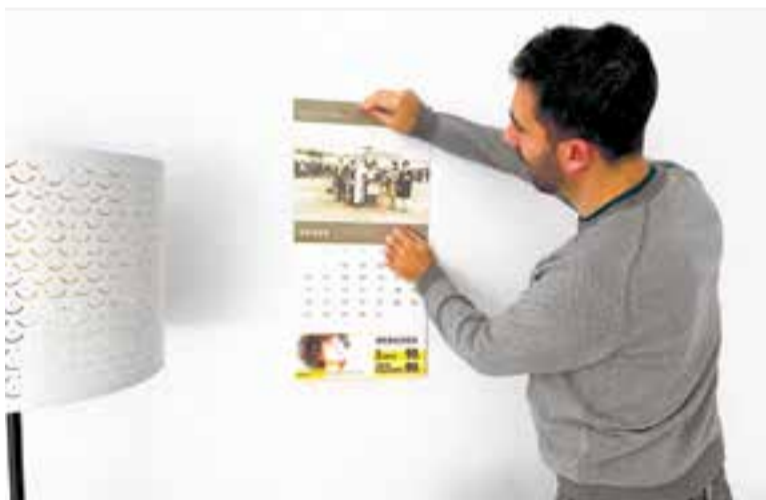
El calendari del 2025 recull tretze fotografies antigues sobre activitats populars. || C. D.

“Ja sé que sona a tòpic i que cada any la gent demana el mateix, però veritablement estar bé és el més important, per això jo a l'any 2025 li demano molta salut per a tothom. Per a mi i per a la família. I un altre desig és que s'acabin les guerres perquè el món està fatal. I en un vessant més personal, vull aprendre a descansar i a tenir cura de mi mateixa.”