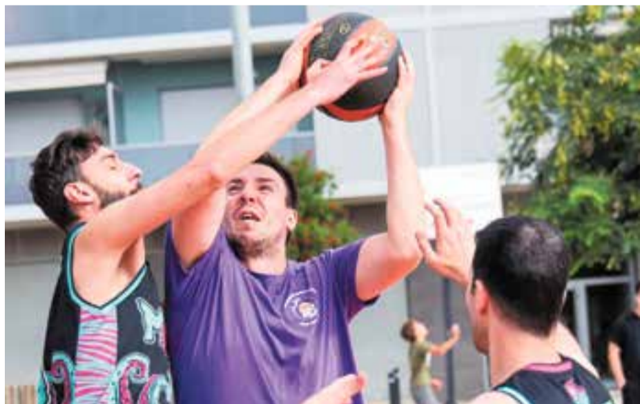
El 3x3 és la modalitat escollida per representar el torneig del Bàsquet Pinya.

Aquest dissabte 4 de gener, el bàsquet castellarenc s'estrena amb el torneig de 3x3 organitzat per l'Associació Foment Bàsquet Pinya Castellar, amb una jornada d'esport solidària, en què una part es destinarà a La Marató de 3Cat.