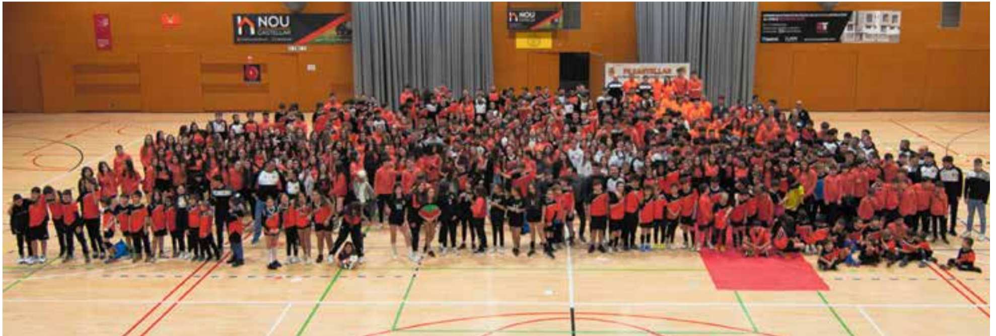
La marea taronja ja supera les 600 fitxes federatives, i situa el vòlei com el segon esport d'equip més practicat a Castellar.

L'FS Castellar va presentar els equips de futbol sala, vòlei i pàdel en una jornada setmanal prèvia a Nadal