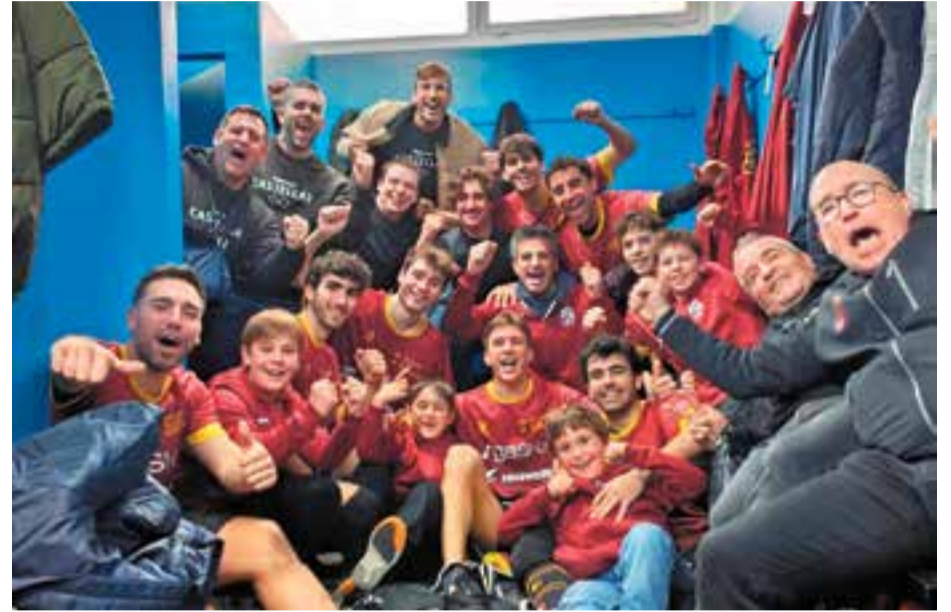
Després de la victòria per 3-5 a Arenys de Munt, els grana són matemàticament campions d'hivern.

Una nova victòria en l'última jornada de l'any deixa l'HC Castellar com a líder en solitari de Nacional Catalana, quatre punts per sobre del Bell-lloc, que va caure contra el Barça.