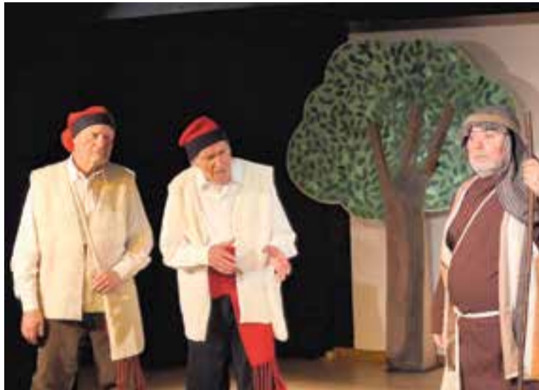
El grup Xitxarel·lo durant la representació d' Els Pastorets.