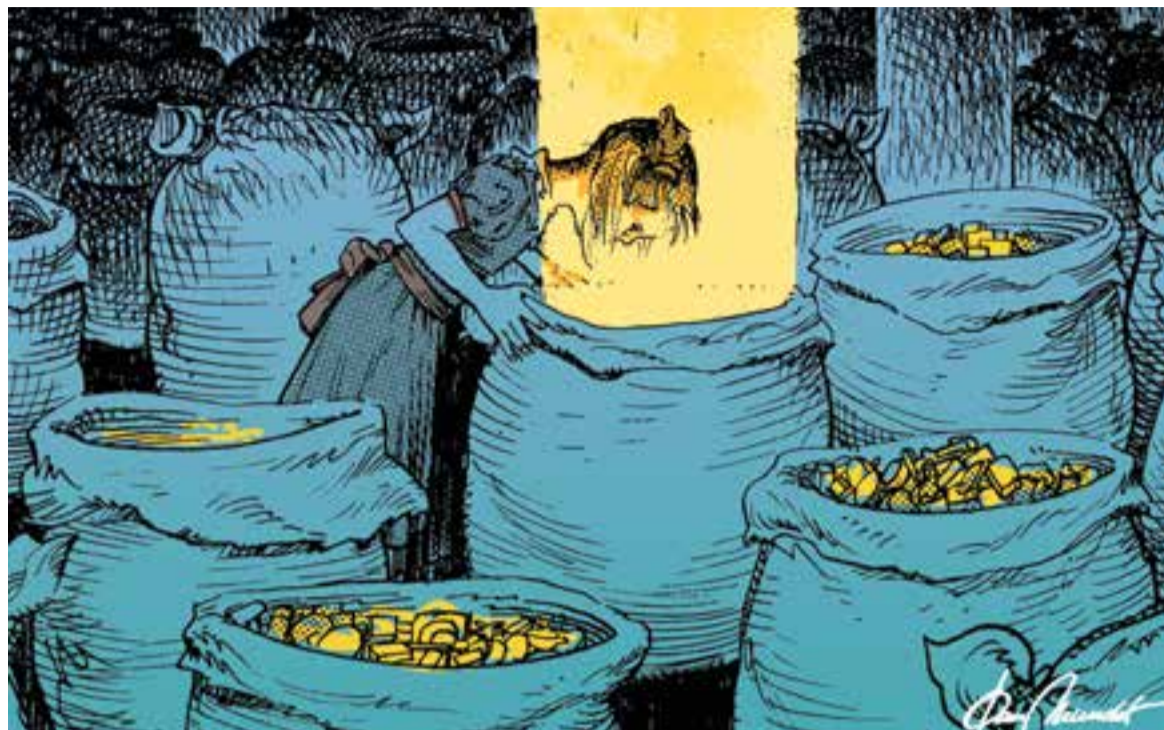
© Un Nadal ple de regals. || JOAN MUNDET

En el pròleg del llibre, sota el títol En tiempos del rey Josías , es fa una declaració d'allò que es desenvoluparà en la resta de l'obra. Diu: " La epopeya històrica contenida en la Bíblia -desde el encuentro de Abraham con Dios y su marcha a Canaán hasta