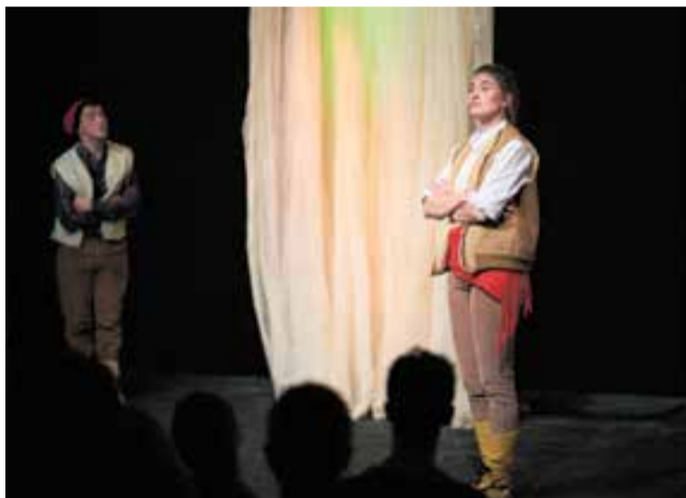
Dels moments de la representació de 'L'Estrella de Nadal' de l'ETC. || Q. PASCUAL