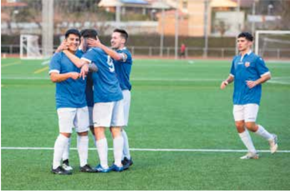
Els jugadors de la UE Castellar celebren el primer gol del partit a Torelló.