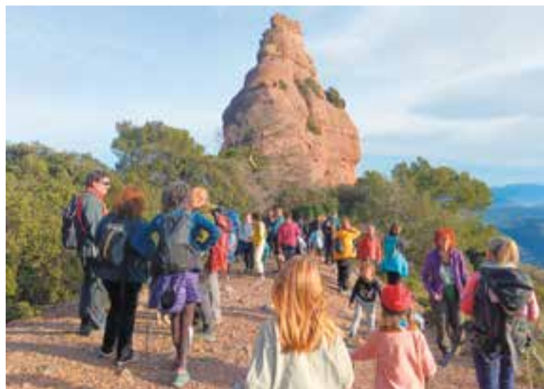
Nombrosos castellarencs van participar a la Pujada del Pessebre a la Castellassa. || M. A.

Un cop al peu de la Castellassa, la gent va celebrar amb alegria la trobada, tot i el fort vent que va bufar. Es van cantar nades mentre els escaladors van pujar el pessebre al cim. Després, es van servir torrons i mistela per a tothom. I, finalment, els més menuts van fer cagar el tió. ✦