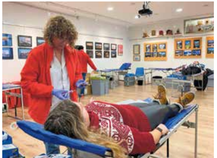
Imatge d'alguns castellarencs a la campanya de donació del CEC, dijous passat. || R. G.