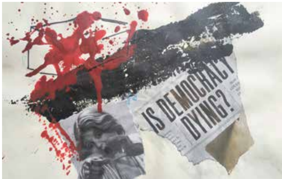
Un dels quadres de Domènec Triviño que es pot veure a partir del dia 10.

'Abstracció i realitat, l'empremta del collage', el títol de la mostra