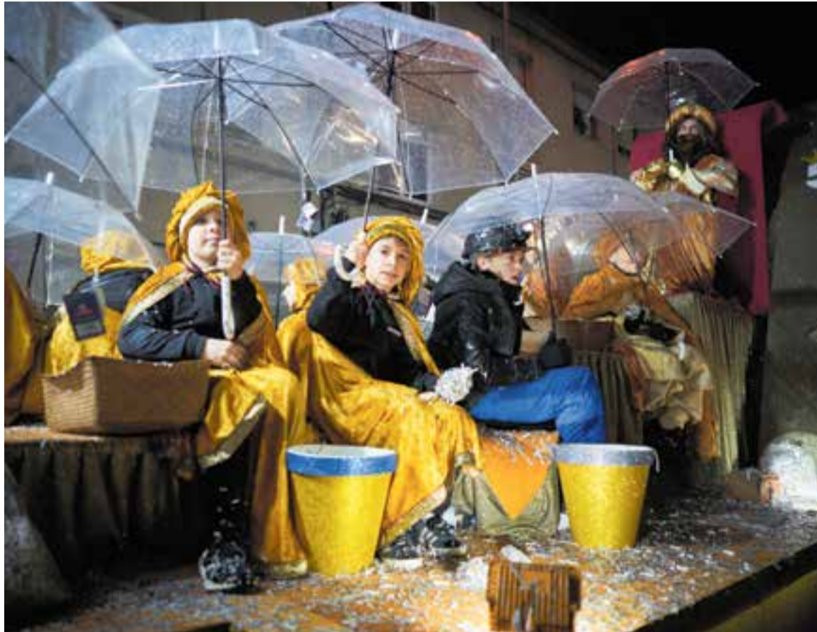
L'any passat, la pluja no va ser cap impediment per gaudir de la cavalcada dels Reis.

La cavalcada començarà l'itinerari al carrer de Portugal a les sis de la tarda, i inclourà novament un tram que es farà en silenci a la plaça de Cal Calissó, com a mesura inclusiva que permeti integrar a la festa els adults i infants amb dificultats per ges-