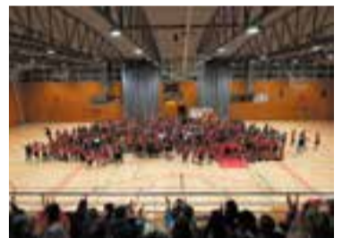
El FS Castellar ha arribat a 629 fitxes en la temporada 2024-25.