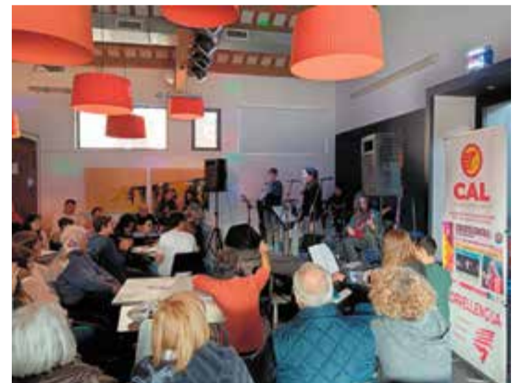
Moment del concert d'Acció Musical Castellar al Correllengua. || M. ANTÚNEZ

El Correllengua és una iniciativa popular que se celebra anualment en els territoris de parla catalana amb l'objectiu de mostrar la vitalitat de la llengua catalana i fomentar-ne l'ús social. A Castellar, s'ha desenvolupat any rere any, organitzat per la CAL. + || M. ANTÚNEZ