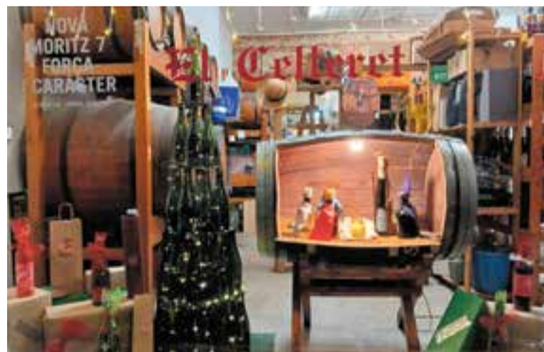
L'aparador d'El Celleret de Castellar ha estat el guanyador del concurs.

Des d'El Celleret de Castellar asseguren estar molt contents perquè ha estat la primera vegada que hi participaven i tot plegat ha estat ini-