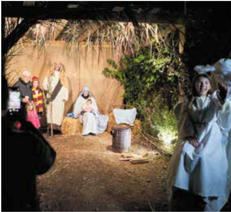
El Naixement, a la nova ubicació del Pessebre Vivent de Sant Feliu del Racó. || Q. P.

Un any més, el Pessebre Vivent de Sant Feliu va atraure molta gent