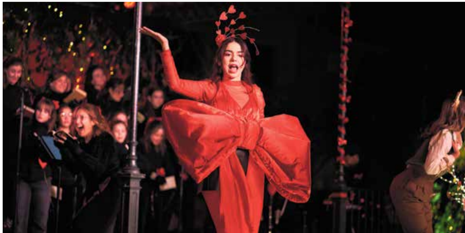
La CuCo va tornar a regalar abraçades als castellers els dies 20, 21 i 22 de desembre.

Convencuda que una abraçada la pot curar, la CuCo intenta posar en marxa la solució. Però es troba que la nena que té davant no vol cap abraçada. I que estrany, oi?, pensa la CuCo,