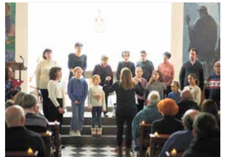
La Coral Pas a Pas va oferir un concert de Nadal a la Capella de Montserrat. || Q. P.

Val a dir que la Coral sempre aposta per la participació de tothom, i és per això que Martí va animar el públic, al final, a acompanyar la coral als cors fent una tornada fàcil de recordar. El públic, molt entregat, va fer cas de les instruccions de la directora i va posar el coixí a totes aquestes veus que, un any més, mostren tot allò que han treballat durant el curs. ✦ || M. ANTÚNEZ