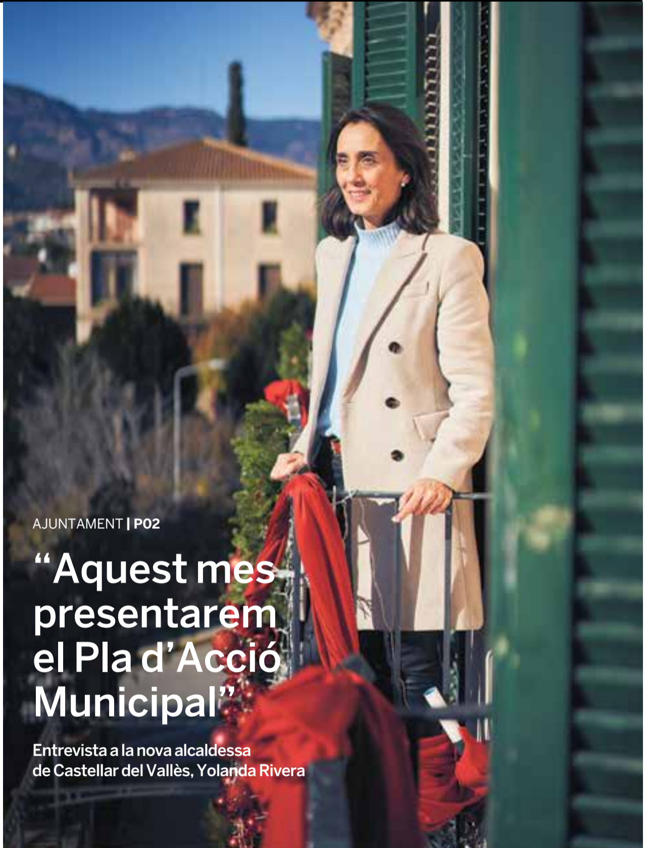
L'alcaldessa Yolanda Rivera al balcó del seu despatx al Palau Tolrà, engalanat amb motius nadalencs. || Q. PASCUAL

Entrevista a la nova alcaldessa de Castellar del Vallès, Yolanda Rivera