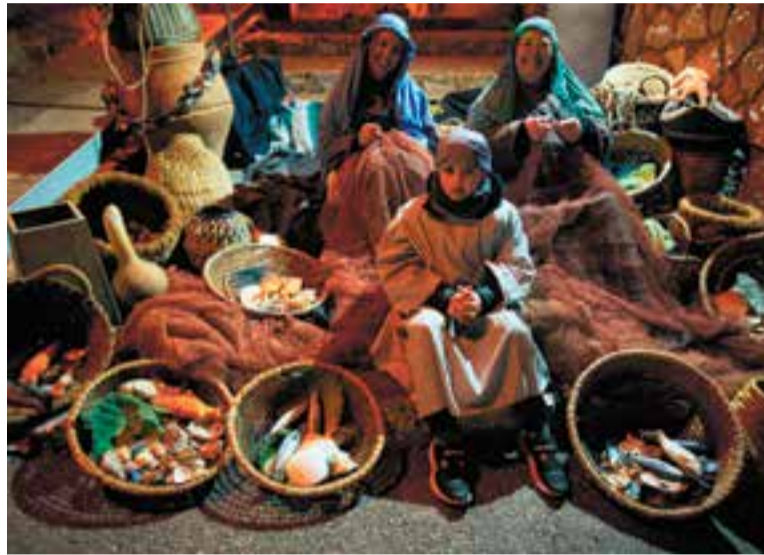
Figurants del 12è Pessebre Vivent de Sant Feliu del Racó. || Q. P.