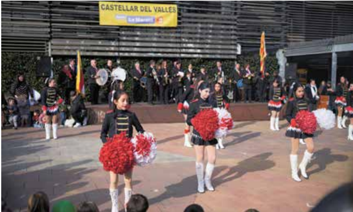
Les majorets en acció durant la matinal dedicada a La Marató de 3Cat.