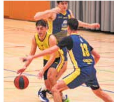
Segona victòria consecutiva.

Important victòria del CB Castellar contra el Grup Barna B (56-63) per refermar la recuperació de l'equip i sumar la segona consecutiva. Els de Jaume Prat deixen enrere el malson del descens per afrontar el futur amb més optimisme després d'unes setmanes infernals que no els han permès desenvolupar el seu potencial. Al barri barceloní del Clot, els groc-i-negres van dominar amb mà de ferro durant els 40 minuts, i van arribar a tenir un màxim avantatge de 18 punts.