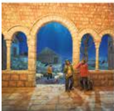
Grup Pessebrista de Castellar