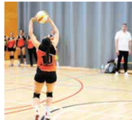
El femení no pot tornar a fallar en Liga. || M. CASALS

La victòria de l'equip masculí contra el Llar Mundet per 3-1 (25-20/25-20/20-25/25-22) permet als de Mehrnaz Totonchi quedar a només un punt de la promoció d'ascens, quan encara resten tres jornades per acabar la primera fase de la Lliga. Farners, Girona i Sant Adrià són els rivals que resten, abans d'acabar a finals de gener i poder disputar per tercera temporada consecutiva el play-off d'ascens.