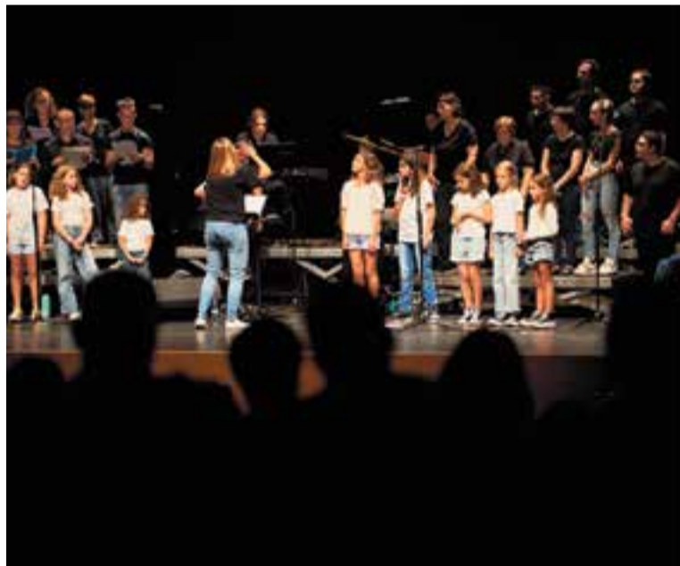
Moment d'un dels concerts anteriors de la Coral Pas a Pas.

Hi haurà una cirereta final, ja que "cantarem una cançó conjunta amb Roger Padrós" , apunta Martí. +