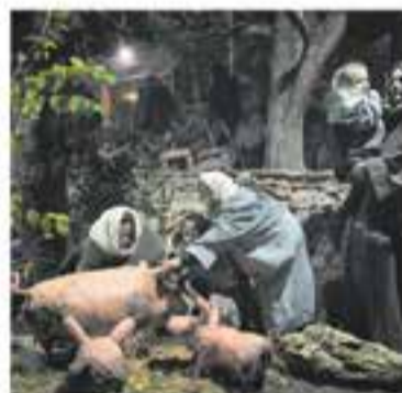
Pessebre Vivent de Sant Feliu

+ INFO: www.castellarvalles.cat/ciclenadalenc