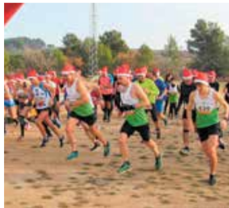
La Sant Silvestre, l'últim acte esportiu de l'any.