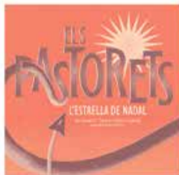
Esbart Teatral de Castellar

+ INFO: www.castellarvalles.cat/pebbebres2024