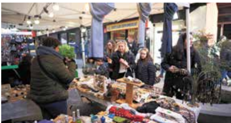
Una de les parades de la Xmas Street ubicada al carrer Sala Boadella.

Més d'una trentena de parades de comerços i una vuitena d'entitats del municipi es van agrupar diumenge passat al carrer Sala Boadella sota el paraigua de la Xmas Street. Segons expliquen des de Comerç Castellar, les compres es van anar succeint a partir del migdia gràcies al bon temps, que va animar els castellarencs a sortir al carrer. Com ja passa des de fa quatre anys, la Xmas