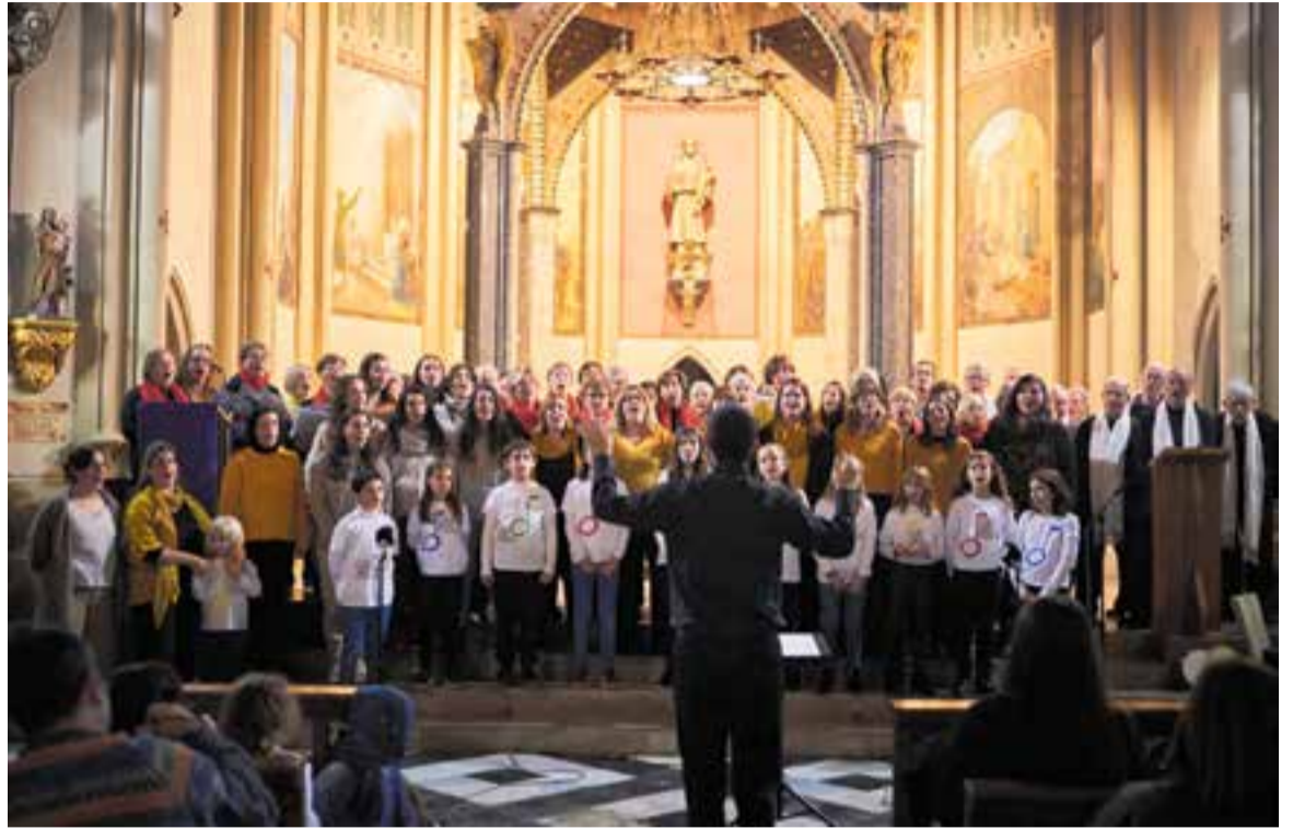
Fusió de la Coral Xiribec amb les diverses corals del Cor Sant Esteve en la part final del concert de Nadal.

El desplegament posterior a l'actuació de la Xiribec del Cor Sant Esteve va ser abassegador. Arrencant amb les Campanetes, la coral de menuts de 3 anys, i passant per les impecables Kor Ítsia o les entusiastes Atzamares, el concert es va desenvolupar amb un ritme gairebé frenètic que impedia abaixar la guàrdia el públic, sempre pendent de qualse-