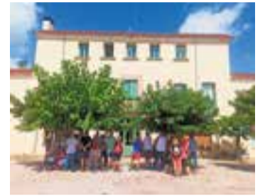
Trobada a Can Carner.

La cooperativa d'habitatge Can Carner, que va celebrar l'octubre passat el primer any de convivència amb una multitudinària jornada de portes obertes, continua amb la seva voluntat de donar-se conèixer a la vila. És per això que dimecres passat va organitzar una conferència a Cal Calissó per explicar què és una cooperativa d'habitatge “com a alternativa al mercat immobiliari, com va ser el procés de rehabilitació de la Masia de Can Carner” i també detallar quantes unitats familiars hi viuen i com s'organitzen, i quins projectes han posat en marxa.