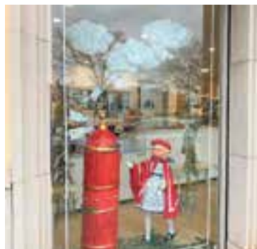
L'aparador de Llullu Cakes del 2023.

La votació es podrà fer fins al 30 de desembre, i permet votar un o