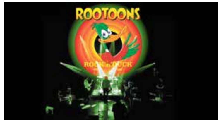
Els sabadellencs Rotoons actuen al bar del Centre Feliuenc, dissabte.

La banda Rotoons actua dissabte, 21 de desembre i a les 22.30 h, al bar del Centre Feliuenc de Sant Feliu del Racó. Aquesta potent banda de rock i blues de Sabadell i rodalies que aposta per un so cru, directe i sense artificis, és la nova proposta de l'entitat Centre Feliuenc Cultural i Recreatiu per amenitzar la vetllada als santfeliuencs.