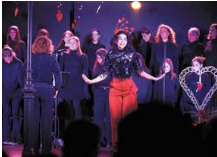
El personatge màgic CuCo durant l'espectacle de l'any passat.

Així, els dies 20, 21 i 22 a partir de les 18.30 h la CuCo i nous personatges que l'acompanyaran explicaran històries i aventures que convidaran els espectadors a reflexionar. La idea d'aquesta proposta de 30 minuts és tornar la llum a l'ànima i restaurar l'alegria i l'amor a tots els cors. Tothom qui ho vulgui, podrà participar d'aquesta càpsula-espectacle; gaudir de la música i les