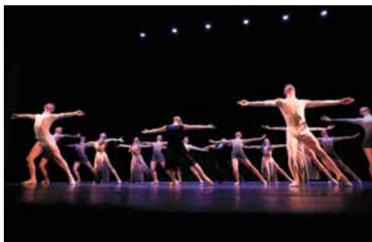
Ballarins del Jove Ballet de Catalunya, en una de les seves actuacions passades.

A l'espectacle, sonaran cançons de Coldplay, Queen i nades. Hi ha un fil conductor, però no hi ha trama com a tal, "cada peça té identitat pròpia" . Les entrades es poden adquirir de forma anticipada al web www.joveballetdecatalunya.com . +