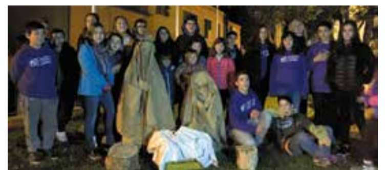
Plantada del pessebre de Colònies i Esplai Xiribec, fa set anys.

Enguany, i com és costum, tornaran a plantar un pessebre fet pels infants i joves de l'esplai. Es podrà visitar fins al dilluns, 6 de gener. +||M.A.