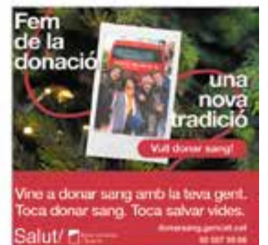
Banc de Sang i Tebits