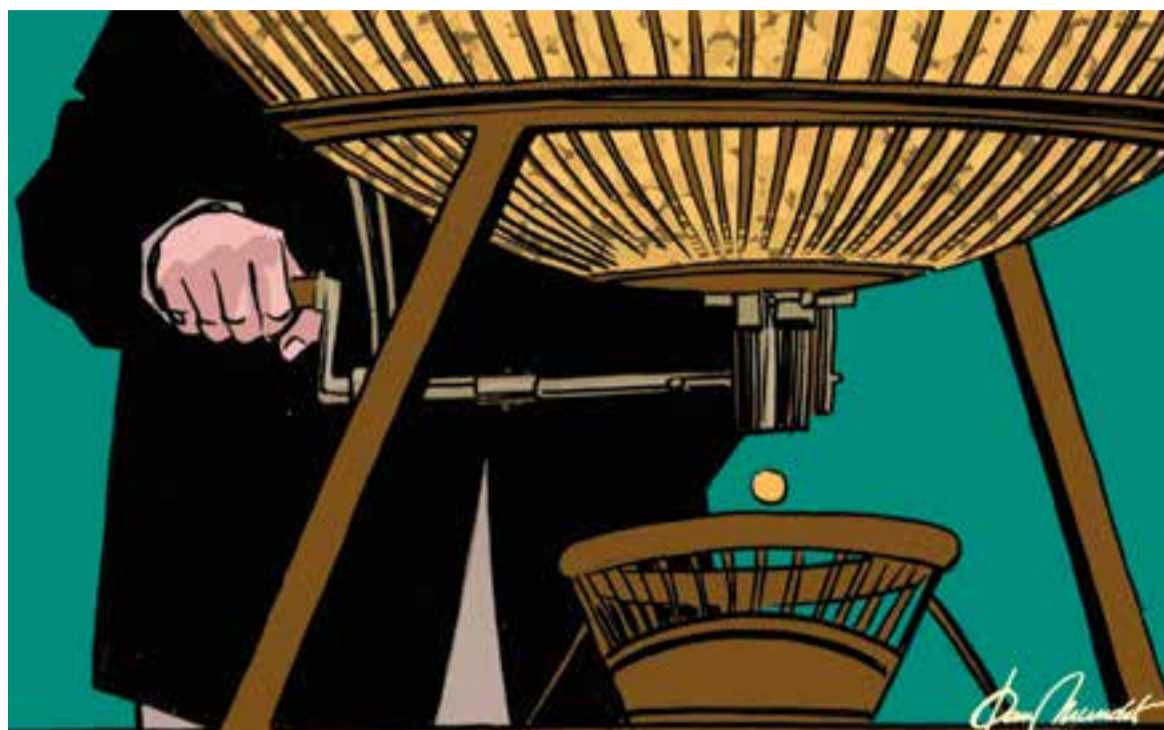
© Cent mil noms o més. || JOAN MUNDET

“Em fa certa gràcia llegir corrues infinites de percentatges de qualsevol matèria”