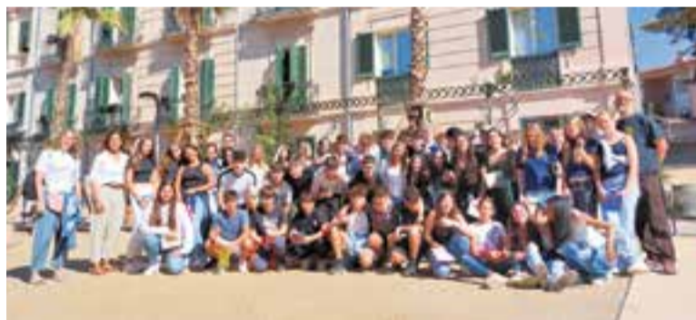
Els estudiants danesos amb alumnes d'El Casal davant del Palau Tolrà.

Dilluns passat l'Ajuntament de Castellar va acollir una recepció a un grup d'estudiants d'un centre de secundària danès que estan duent a terme un projecte d'intercanvi internacional amb els alumnes de 3r d'ESO de l'escola El Casal. En total, són vint-i-tres nois i noies, acompanyats de professorat, que han viatjat a Catalunya procedents d'un centre educatiu de Måløv, població de prop de 9.000 habitants situada 20 km a l'oest de Copenhaguen. Aquest és el sisè curs que El Casal i el centre danès duen a terme aquest projecte, anomenat Exchange Project, en el marc del qual es fan diverses activitats curriculars en els àmbits d'anglès, cultura i valors i treball de síntesi. + || REDACCIÓ