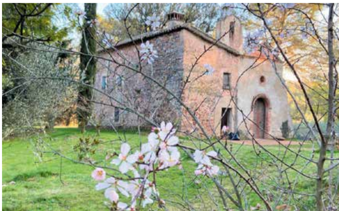
L'Ermita de les Arenes serà un dels punts de parada en les activitats de les JEP 2024 a Castellar del Vallès.

Diumenge 13 d'octubre, també programat pel CECV-AH i guiat per Genescà, s'oferirà un itinerari a les masies de Can Carner i Can Pèlags,