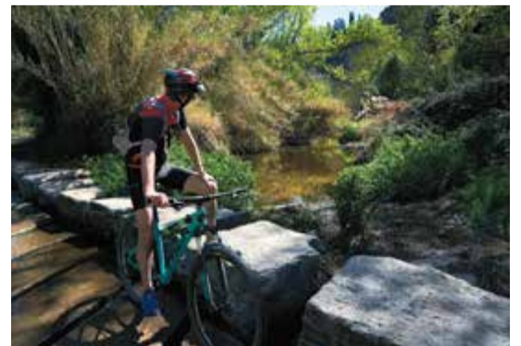
Imatge del riu Ripoll al terme de Castellar.

Recentment s'ha adjudicat la licitació de l'execució l'aplicació mòbil que permetrà fer les visites virtuals i conèixer tots els elements d'interès al voltant del riu Ripoll. + || REDACCIÓ