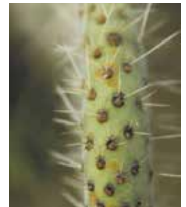
Fotografia d'Andrea Codina. || CEDIDA

Codina és estudiant de grau superior de fotografia. Tot i la seva joventut, presenta una sèrie de fotografies amb tècnica i coneixement. Les imatges que exposa han estat preses al Jardí Botànic de Montjuïc. La mostra es podrà veure fins al 7 de novembre. + || M. A.