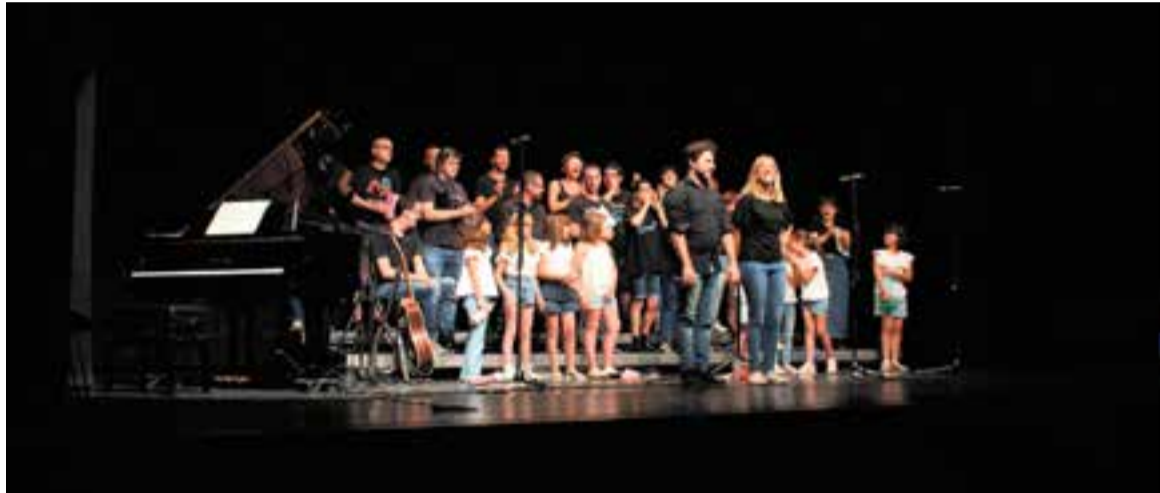
La Coral Pas a Pas va oferir un concert titulat 'Les nostres cançons' diumenge passat a l'Auditori Municipal.

El públic va poder acompanyar els cantaires a l'Auditori, diumenge