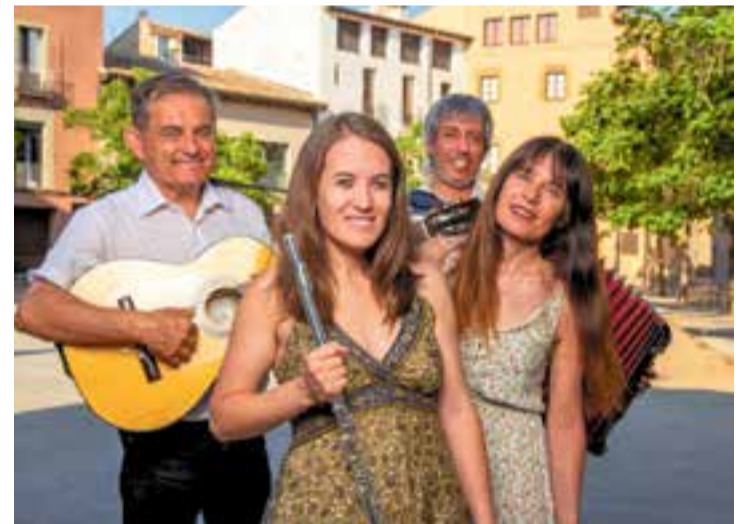
La companyia castellarenc Bufanúvols actuarà a Fira Mediterrània.

El projecte segueix tres grans itineraris: un de música, amb l'escena mediterrània de músiques del món i música folk; un de dansa, amb una mirada en moviment a l'arrel tradicional i la cultura popular; i un de memòria, llegat i narració oral, amb les propostes d'arts escèniques i de carrer, especialment de teatre i circ. +