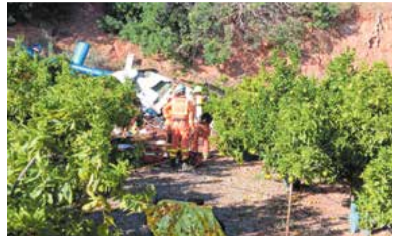
Els bombers actuant a l'helicòpter sinistrat.

Amb 17 anys va venir a viure Castellar i va treballar molts anys