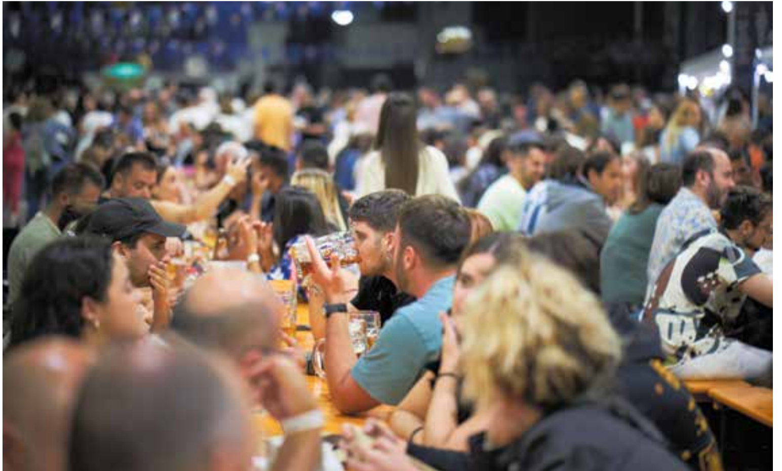
El moment àlgid de la festa de la cervesa a Castellar va ser dissabte, just abans del concert d'Hotel Cochambre.

El punt àlgid de l'Oktoberfest castellarenc va ser dissabte a la nit. Entre les 21 hores i les 23.30 hores, coincidint amb el concert d'Hotel Cochambre, el recinte va fer ple. Mil persones ballant, saltant, bevent i sopant. “Quan vam veure l'assistència, de seguida vam haver de reorganitzar l'espai. Vam retirar taules i bancs i vam obrir les entrades del darrere i les d'emergència” . Justament en aquest horari és quan es van formar