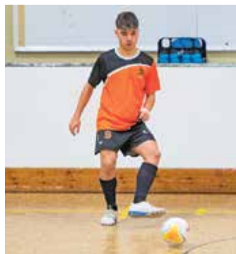
L'FSC va caure contra el Ciutat de Mataró. || A.S.A.

L'FS Castellar va obrir la temporada 24-25 caient a casa contra un equip recentment ascendit com el Ciutat de Mataró, el qual va rascar un 3-4 per sumar els tres punts al Joaquim Blume i deixar amb un pam de nas els taronges.