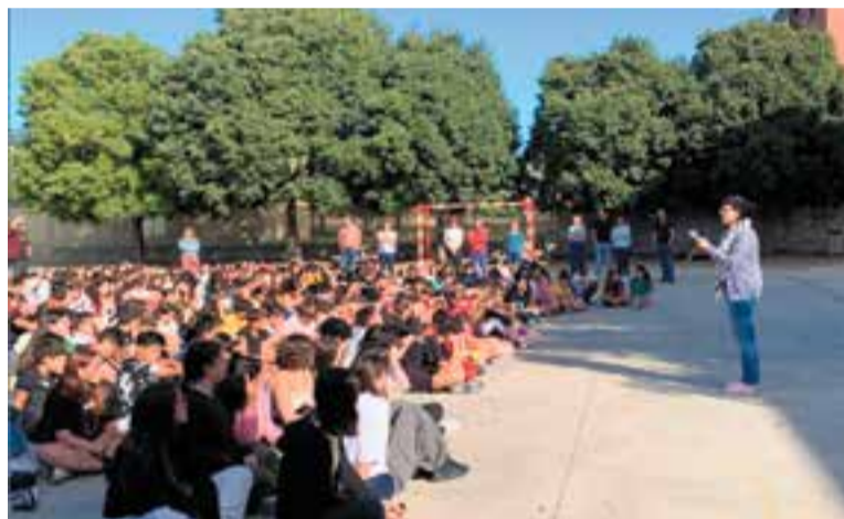
El manifest als instituts Puig de la Creu (foto superior) i Castellar.