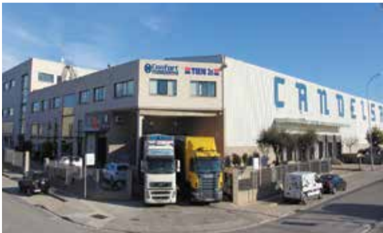
Seu de Candelsa al polígon del Pla de la Bruguera.

facció amb la comunicació entre l'equip de vendes i el comercial ha estat un dels pilars fonamentals d'aquest èxit" . Candelsa continua invertint per oferir als seus clients solucions tecnològiques innovadores. "El nostre portal i intranet de negoci ha estat reconegut pels nostres clients i fabricants com l'eina més avançada, dinàmica i moderna del sector" , expliquen. + || REDACCIÓ