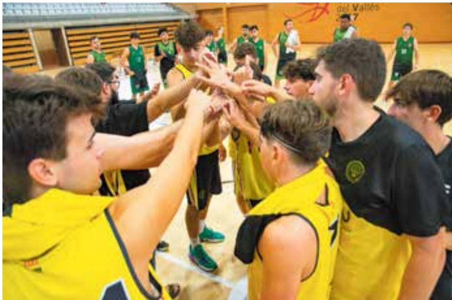
Cap dels dos primers equips va poder sumar una victòria en la segona jornada de Lliga. || A. SAN ANDRÉS

El CB Castellar va perdre els dos partits d'aquesta jornada amb el sènior masculí i el femení. Els primers van caure per 61 a 56 contra el CB Cornellà B, un dels equips cridats a ser dels més potents del grup, i les de Xavi Revilla ho van fer per 41-43.