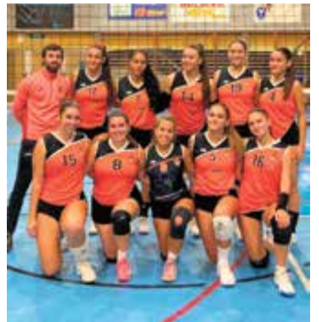
El femení en el partit contra el Prat.

Quant al masculí, l'equip entrenat per la iraniana Mehrnaz Totonchi va caure al tie-break (25-22/22-25/25-23/21-25/12-1) contra el Get Blume, en l'estrena al Pavelló Puigverd.