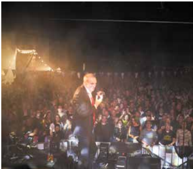
El concert d'Hotel Cochambre va aplegar mil persones.

se'n van vendre 2.500 litres–, la de Castellar va ser una proposta que no deixava fora ningú. És cert que alguns DJs i determinades hores esqueien més a un públic, però en general, tant infants com adolescents o gent gran tenien el seu lloc a l'Oktoberfest. I no només de la vila, també gent de municipis veïns. “La gent de Castellar respon sempre a qualsevol proposta, sigui una festa, una fira d'artesanía o un correbraves” , va sentenciar Górriz. ✦